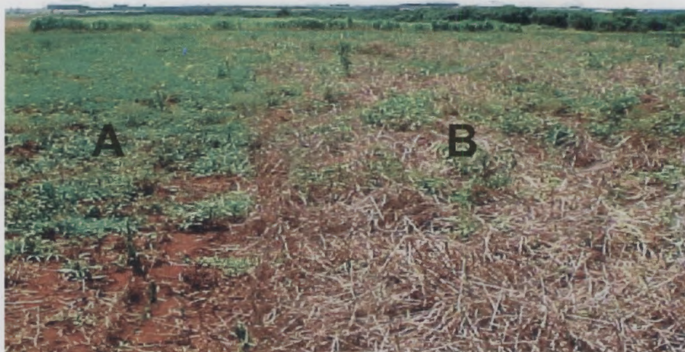
Fig. 2. Aspecto da área onde houve fenação (A) x área sem fenação (B), destacando a cobertura com palha de aveia. Embrapa Agropecuária Oeste, Dourados, MS, 2000.