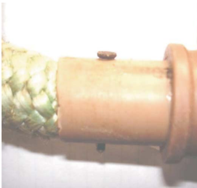
Fig. 1. Detalhe da fixação da corda ao adaptador.