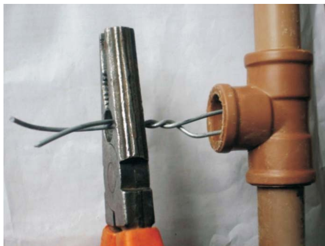
Fig. 2. Centralização e corte do arame na saída do "T"

Para aplicar o produto basta passar duas vezes por sobre a vegetação num movimento de ida e volta, com o cuidado para não aplicar sobre as espécies desejáveis. Uma vez que o produto tem ação sistêmica, este circulará pela planta causando a sua morte dentro de alguns dias, de acordo com as condições meteorológicas e fisiológicas da planta.