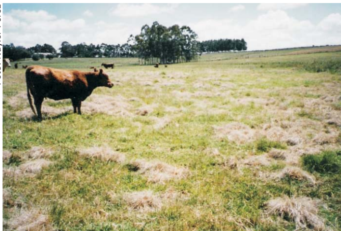
Pastagem nativa após controle de invasoras com a enxada química.