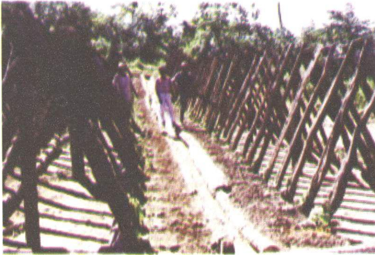
Fig. 1. Sistema de produção de mudas em espaldadeira.

A adubação pode ser feita na cova de cada planta ou em toda a leira, usando-se a mistura de 70% de solo de mata e 30% de matéria orgânica (esterco de gado curtido ou torta de mamona ou torta de algodão ou cama de aviário). As mudas são plantadas em covas abertas próximo à base do estacão, sendo amarradas ao estacão com barbante de sisal, algodão ou fita de plástico para facilitar a aderência das plantas aos tutores de madeira.