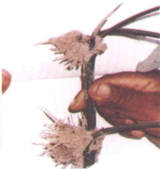
Fig. 5. Emissão de raízes em estacas herbáceas, 30 dias após o plantio em câmara de pré-enraizamento.