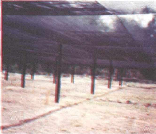
Fig. 7. Viveiro comercial coberto com sombrite para manutenção das mudas.