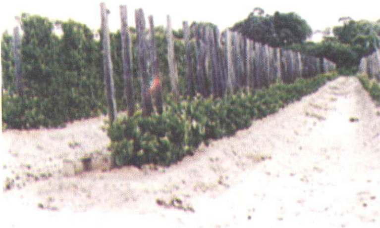
Fig. 9. Corte de plantas matrizes para produção de novas estacas.