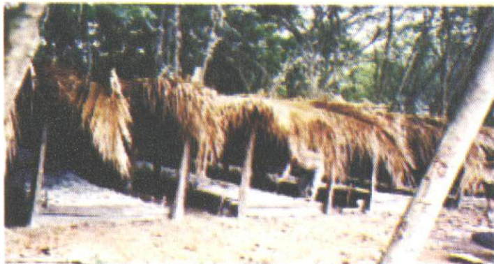
Fig. 2. Câmaras de pré-enraizamento com leito de areia, cobertas com folhas de palmeira (açazeiro, bacabeira, babaçu).