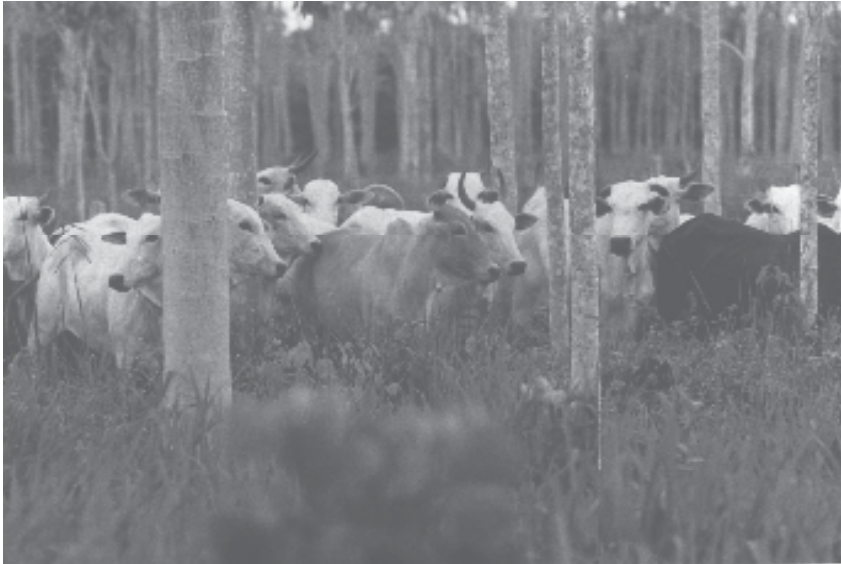
FIG. 4. Sistema silvipastoril paricá ( Schizolobium amazonicum Huber ex. Ducke) x braquiarião ( Brachiaria brizantha Stapf.), aos seis anos, em Paragominas, PA.