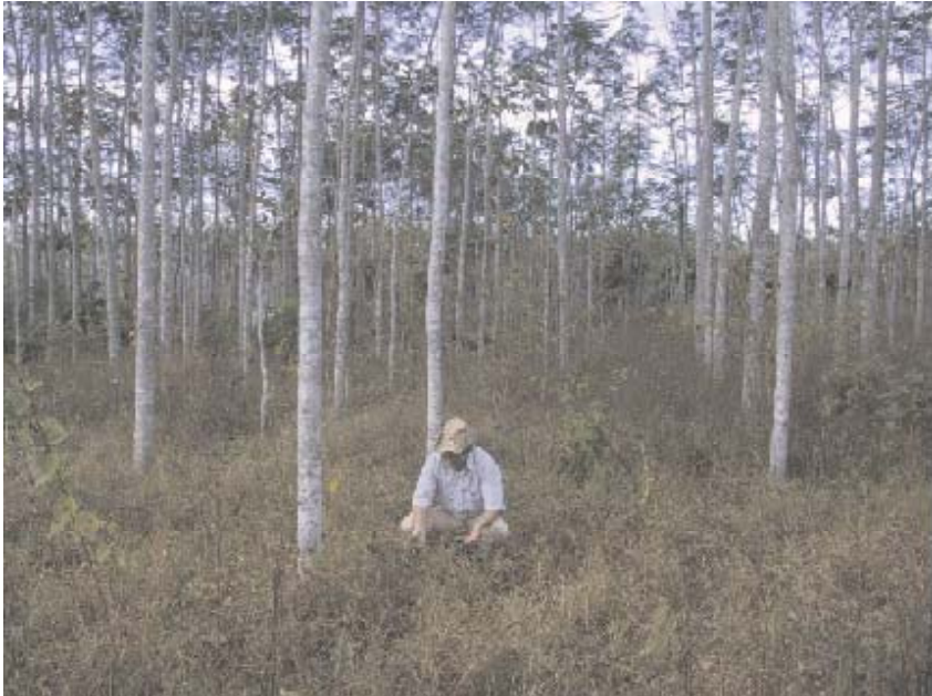
FIG. 1. Sistema silvipastoril paricá ( Schizolobium amazonicum Huber ex. Ducke) x teca ( Tectona grandis L. f.) x quicuio ( Bacharia humidicola (Rendle) Schweick), aos seis anos, em Redenção, PA.