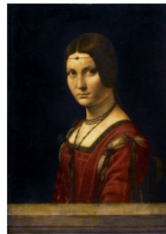
Abb. 1: Porträts von Leonardo da Vinci bzw. seinen Schülern. Welches Porträt ist komplexer?