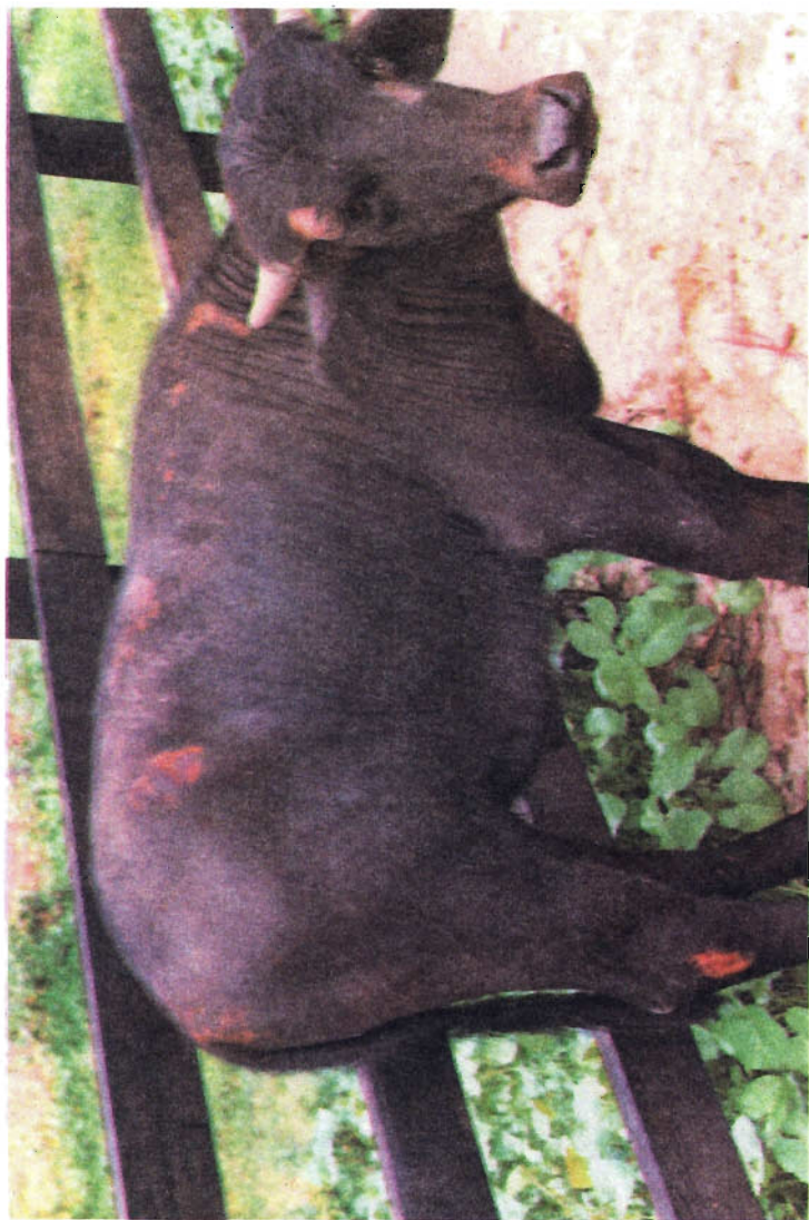
FIG. 3 - Lesões fotossensibilizantes em búfalo intoxicado por Lantana camara var. mutabilis .