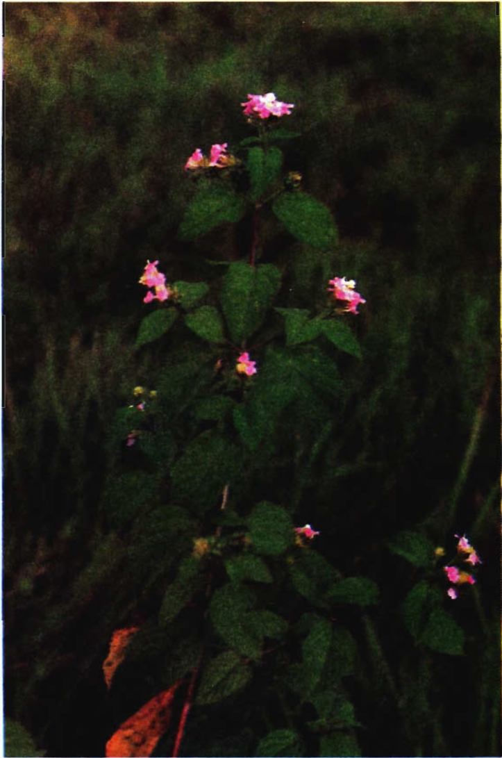
FIG. 1 - Lantana camara var. mutabilis em pastagem de qui- cuio-da-amazônia ( Brachiaria humidicola ).