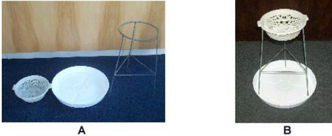
Figura 2 – Estruturas para criação de larvas de moscas, A separadas e B em conjunto

ESMAIL, S.H.M. Fly pupae as a protein source. Misset - World Poultry , v. 12, n. 10, p. 69-70, 1996.