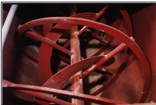
Foto 1. Detalhes internos de um misturador horizontal provido de fitas.

O misturador horizontal é o mais encontrado em fábricas de ração de maior porte. Esse misturador pode ser provido de fitas ou de pás que revolvem a mistura de um lado para o outro, repartindo-a em várias partes, e promovendo uma eficiente mistura ao longo de todo o misturador. Esses misturadores são geralmente providos de portas de descarga que permitem o rápido esvaziamento do misturador assim como maior facilidade para limpeza. O carregamento do misturador com uma quantidade acima da sua capacidade dificulta a mistura. As fitas ou pás devem emergir ao menos 5 a 7 cm acima do topo da mistura. A maior vantagem dos misturadores horizontais sobre os verticais é que eles permitem uma mistura mais homogênea (menores coeficientes de variação entre diferentes amostras coletadas há um mesmo tempo) e um menor tempo de mistura, que em geral, é de 3 a 5 minutos. Outra vantagem é que ele permite o uso de maior quantidade de líquidos na mistura. Em geral, a máxima quantidade de líquidos adicionada, em condições práticas, é 10%.