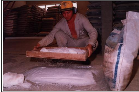
Foto 4. Peneiramento do sal antes do seu uso com o objetivo de eliminar os torrões.

No preparo das rações, os seguintes cuidados e etapas devem ser seguidos: