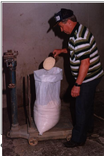
Foto 6. O uso de balanças precisas é indispensável.

disso, as balanças devem apresentar boa precisão e sensibilidade, evitando-se o uso de balanças de vara. A utilização de baldes ou outro sistema que meça o volume, em vez do peso, não deve acontecer em nenhuma hipótese, pois há erros decorrentes da variação nas densidades de diferentes ingredientes ou de diferentes partidas de um mesmo ingrediente.