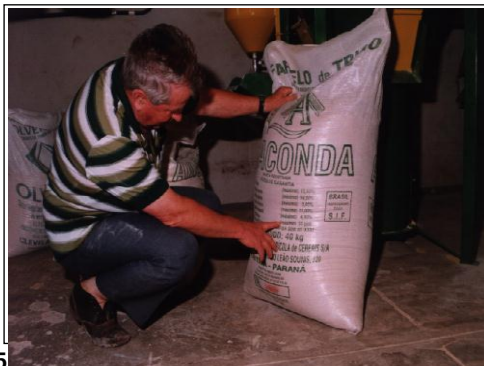
Foto 5. Leitura do rótulo do produto pelo cliente.