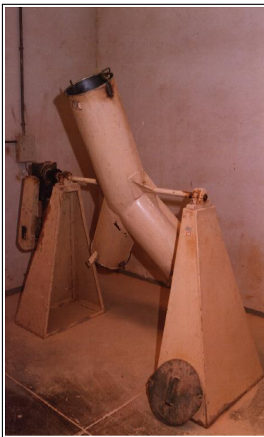
Foto 3. Misturador em Y.

quantidade média de líquidos a ser adicionada, grau de limpeza necessário, custo do equipamento, automatização do processo e gastos, incluindo mão de obra, para operação e manutenção do misturador.