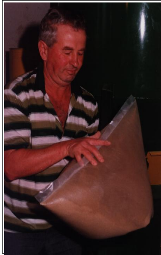
Foto 7. Produtor preparando a pré-mistura.