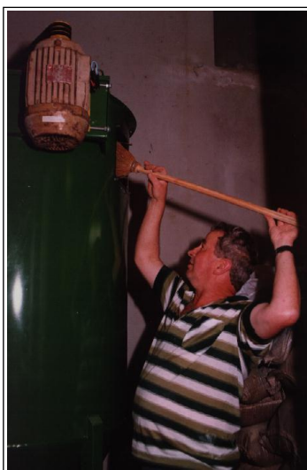
Foto 9. Detalhe da limpeza da parte superior de um misturador vertical através de uma janela de inspeção.