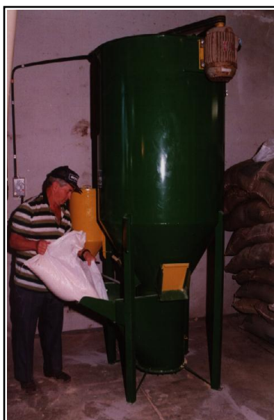
Foto 2. Produtor carregando um misturador vertical.

de mistura de 3 a 19 minutos. A mistura dos ingredientes ocorre, essencialmente, no topo e na base do misturador. O tempo de descarga de um misturador vertical é aproximadamente o mesmo de um horizontal, mas apresenta dificuldades para sua completa limpeza. A adição de mais de 3% de líquidos a um misturador vertical não é recomendada, constituindo-se em outra limitação desse tipo de equipamento. Contudo, a grande vantagem do misturador vertical é o seu baixo custo, fazendo com que seja largamente utilizado em pequenas fabricas de rações comerciais e em propriedades. Além disso, eles não necessitam de outros equipamentos como silos anexos para armazenagem de ingredientes ou para descarregar a mistura pronta.