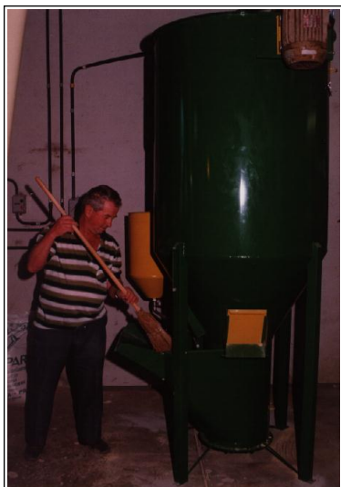
Foto 8. Após o uso e com o motor desligado, deve ser realizada a limpeza do misturador.