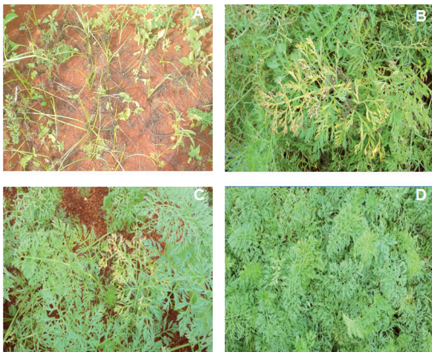
Figura 2. Severidade da queima das folhas nas cultivares Juliana (A), Brasília (B), BRS Esplanada (C) e BRS Planalto (D) em experimento avaliado na Embrapa Hortaliças na safra 2009/10. Brasília-DF, 2010.

A cv. BRS Esplanada foi mais tolerante aos danos da queima das folhas que a cv. Brasília, porém inferior à cv. BRS Planalto. Contudo, após três décadas de seu lançamento, a cv. Brasília ainda é mais tolerante que a cv. Juliana. Em cultivos de Juliana, sem a aplicação de fungicidas, noventa dias após a semeadura foi observado praticamente 100% de desfolha, sem produção comercial (Figura 2A).