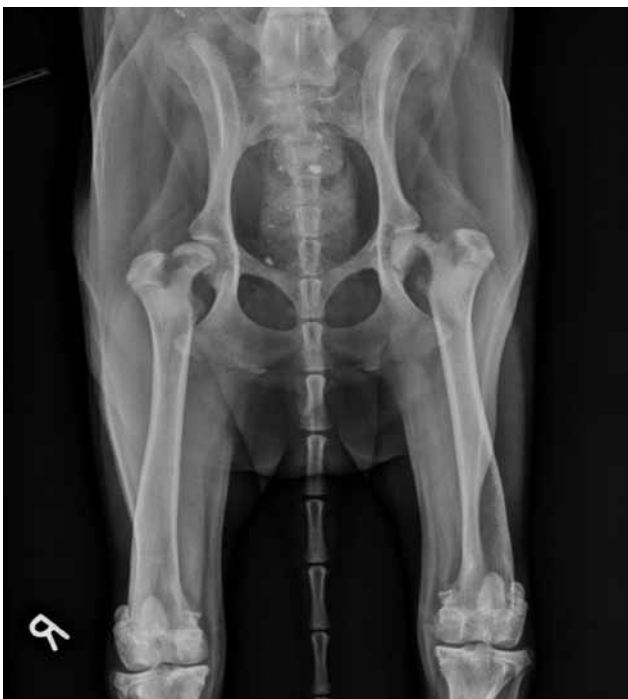
Figuur 2. Ventro-dorsale radiografie van de heupen op een leeftijd van dertien maanden. Volgende afwijkingen zijn zichtbaar: links is er een fractuur ter hoogte van de proximale, femorale groeiplaat en een heterogeen aspect van de femurhals met gedeeltelijke botresorptie. De rechterfemurkop is cranio-lateraal verplaatst ten opzichte van het acetabulum en de femurhals is op zijn beurt craniaal verplaatst ten opzichte van de femurkop. Er is ook uitgesproken spieratrofie zichtbaar.

groeiplaat, of osteochondrose, wordt verondersteld een rol te spelen in de pathogenese (Olsson en Ekman, 2002).