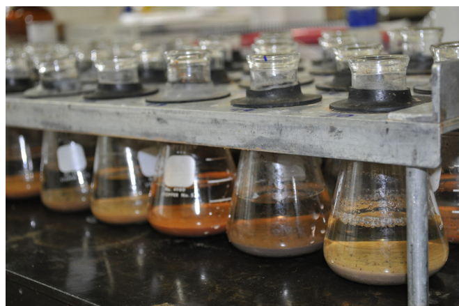
Figura 2. Extratos prontos para a dosagem dos teores de P-rem, após 16 horas de descanso.