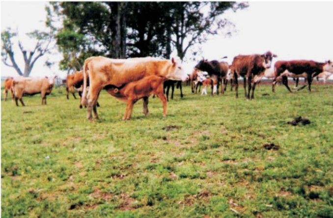
Fig. 1. Vacas com terneiros em aleitamento