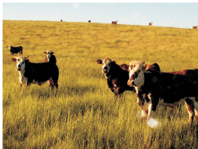
Fig. 6. Novilhos ao sobreano em Pastagem Cultivada.