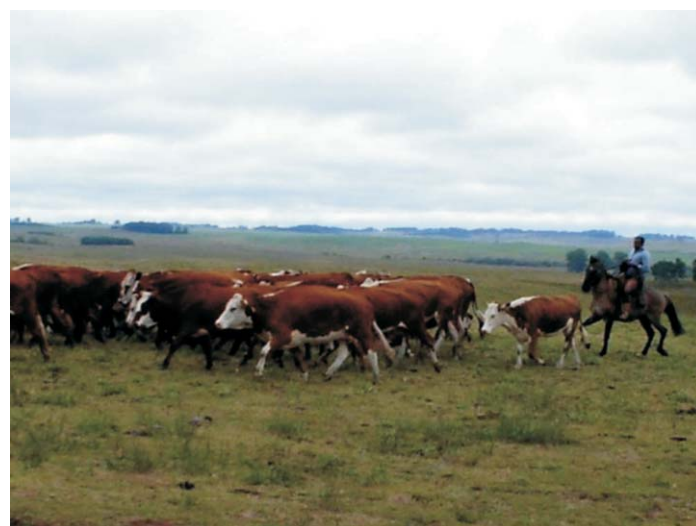
Fig. 7. Novilhos ao sobreano em Campo Nativo.