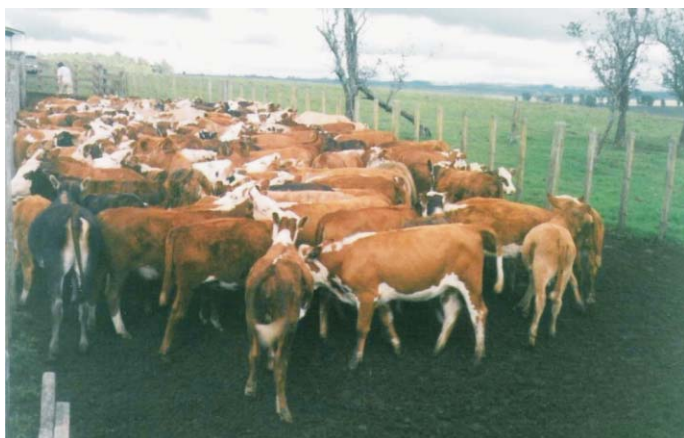
Fig. 3. Terneiros na mangueira já totalmente desmamados – PERÍODO DE DESMAME.