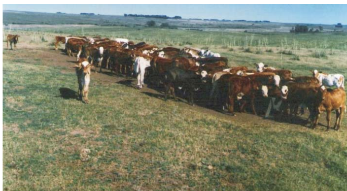
Fig. 5. Terneiros desmamados em potreiro de Campo Nativo – PERÍODO DE PÓS-DESMAME.