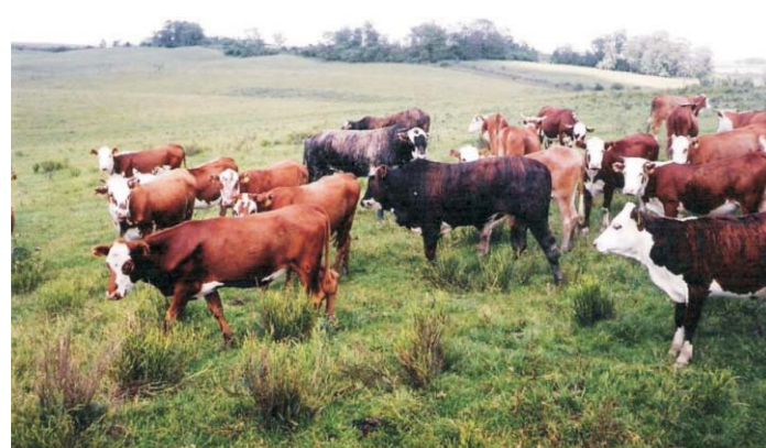
Fig. 8. Novilhas desmamadas precocemente, acasaladas em potreiro de Campo Nativo, aos dois anos de idade.

A prática de desmamar terneiros precocemente visa, em um primeiro momento, incrementar os índices de fertilidade da totalidade do rebanho por proporcionar às vacas de cria um comportamento como de ventres solteiros durante o período de acasalamento.