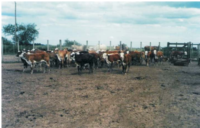
Fig. 2. Terneiros na mangueira com vacas no lado externo da mesma – PERÍODO PRÉ DESMAME.