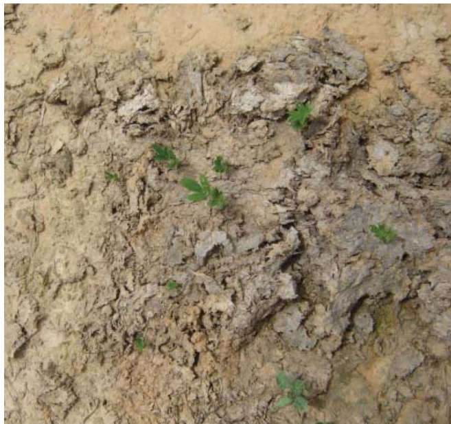
Figura 3. Plântulas de estilosantes Campo Grande emergidas de uma placa de fezes de vacas leiteiras que ingeriram sementes da leguminosa junto ao sal mineral na Colônia Sara, em Brasileia, AC.

Em qualquer modalidade de plantio, o manejo de formação do consórcio deve ser direcionado para evitar uma alta competição da gramínea com a leguminosa nos primeiros 90 dias. Para isso, o pastejo deve ser iniciado de 30 a 40 dias, após a introdução da leguminosa em pastagens já estabelecidas, e de 40 a 50 dias após o plantio de pastagens novas. Esses prazos podem variar de acordo com a espécie e cultivar de gramínea, fertilidade do solo, temperatura e umidade no período, porém é importante evitar o sombreamento da leguminosa pela gramínea, já que esta geralmente apresenta maior velocidade de estabelecimento. Nesse primeiro pastejo, recomenda-se o uso de animais jovens, em período suficiente para rebaixar a gramínea até aproximadamente 15 cm do solo (ESTILOSANTES..., 2000; CULTIVO..., 2007).