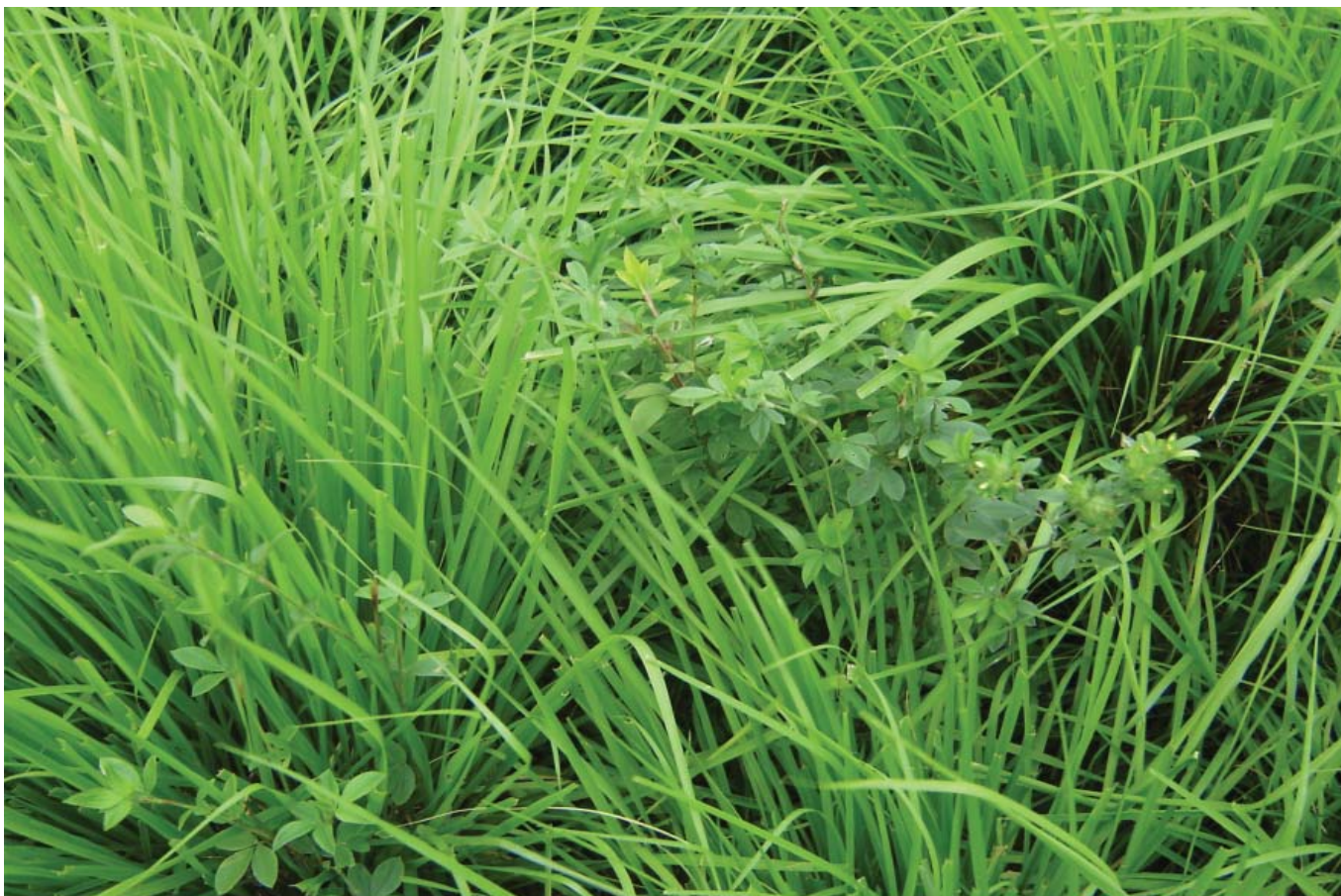
Figura 5. Pasto consorciado de capim-massai e estilosantes Campo Grande na Fazenda Lua Nova, em Rio Branco, AC.