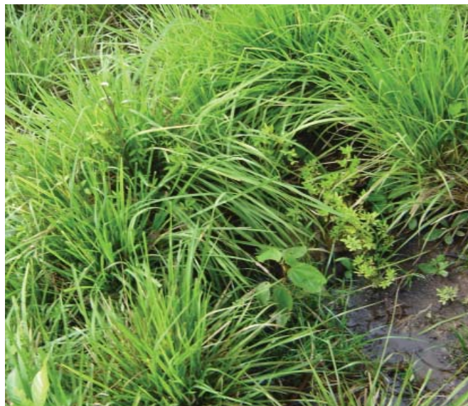
Figura 2. Plantas de estilosantes Campo Grande e capim-massai em um sítio da pastagem sujeito ao alagamento do solo na Fazenda Lua Nova, em Rio Branco, AC.

Portanto, recomenda-se que o estilosantes Campo Grande seja plantado no Acre somente em áreas com solos arenosos, que apresentem boa drenagem natural e não sejam sujeitos ao encharcamento, mesmo que temporário, durante a estação chuvosa.