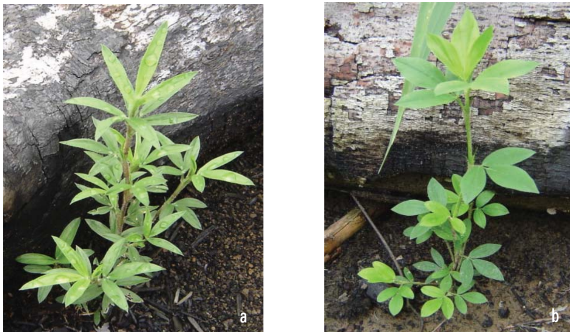
Figura 1. Plantas do estilosantes Campo Grande, constituído pelas espécies S. macrocephala (a) e S. capitata (b).