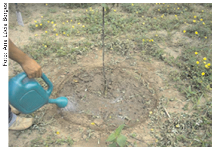
Figura 1. Aplicação do ácido bórico na área delimitada.

O experimento com maracujá amarelo ( Passiflora edulis Sims.), implantando em 20/01/2009, foi conduzido em Latossolo Amarelo distrocoeso de Tabuleiro Costeiro do Estado da Bahia, textura franco-arenosa, contendo baixo teor de boro na camada de 0-20 cm de profundidade ( 0,30 \text{ mg dm}^{-3} ), segundo Ribeiro et al. (1999). O delineamento experimental foi em blocos casualizados com quatro repetições, estudando-se cinco doses de boro (0; 1,0; 1,5; 2,0 e 2,5 \text{kg ha}^{-1} ) na forma de ácido bórico. Este foi dissolvido em 2,5 L de água e aplicado ao redor da planta, num raio de 40 cm do caule do maracujazeiro (delimitado com um guia) (Figura 1). As doses estudadas foram divididas em duas aplicações, aos 184 dias e 244 dias após o plantio, considerando que a maior absorção do nutriente ocorre entre o 6º e o 8º mês. Na cova foram aplicados 400 g de superfosfato simples e 3,5 kg de torta de mamona, e aos 90 dias, 100 g de ureia por planta. As amostragens para análises de solo e folha foram realizadas dois meses (época seca) e sete meses (época chuvosa), após a segunda aplicação (244 dias após o plantio) do nutriente no solo.