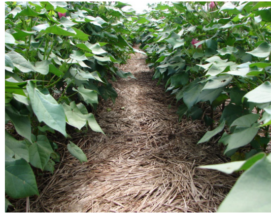
Fig. 3. Algodoeiro no sistema de semeadura direta cultivado sobre palha de Brachiaria ruziziensis .