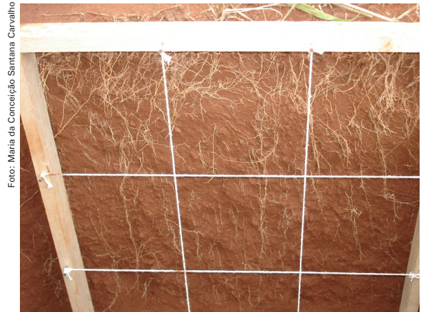
Fig. 2. Desenvolvimento das raízes de Brachiaria ruziziensis no SSD, até 60 cm de profundidade, antes da dessecação e semeadura do algodoeiro.

Ao avaliar oito espécies de cobertura do solo, Andrade et al. (2009) observaram que o milho consorciado com braquiária, a crotalária e o guandu resultaram na maior macroporosidade e também na menor densidade do solo. Garcia e Rosolem (2010) concluem que a maior produção de matéria seca e o crescimento das raízes das gramíneas utilizadas como plantas de cobertura influenciam a maior agregação do solo nas camadas superficiais.