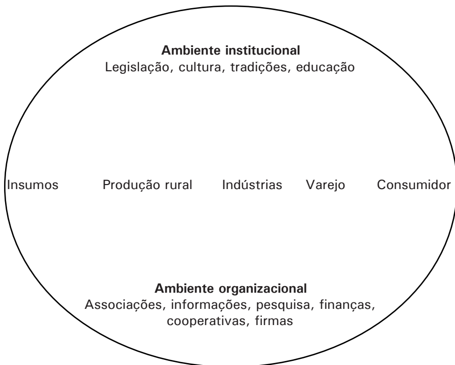
Figura 1 - Sistema agroindustrial típico (Sorrio).