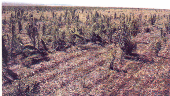
Figura 1. Área de soja infestada com buva que escapou ao controle do dessecante.

favorecidas nas áreas de plantio direto e pousio, por possuírem sementes pequenas e facilmente carregadas pelo vento, ampliando rapidamente as áreas de infestação. Porém, nas áreas com manejo de entressafra, essas espécies são mantidas sob controle. Paralelamente, as pesquisas mostram que o controle das plantas daninhas na Soja RR é facilitado quando integrado com outras práticas, como o cultivo de aveia na entressafra para formação de cobertura morta (Gazziero, 2003).