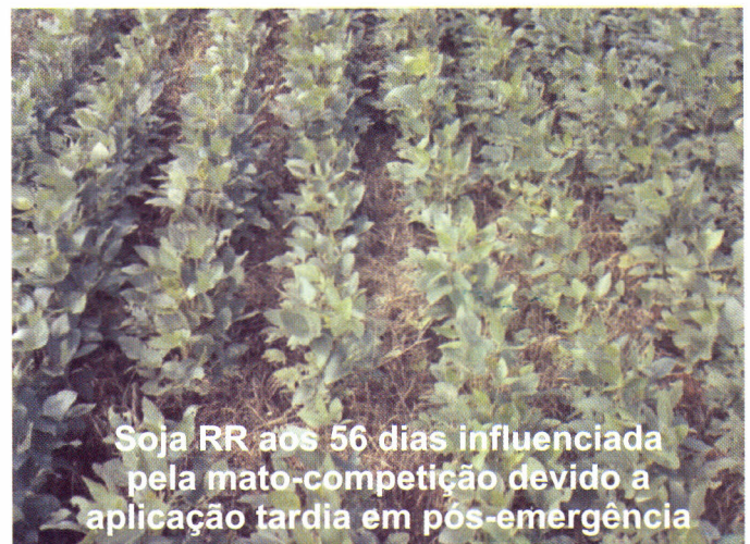
Figura 4. A aplicação em pós-emergência na soja RR deve ser feita seguindo-se as indicações técnicas de uso do produto.