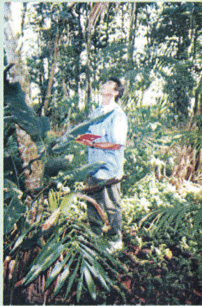
FIG. 1. Coletor botânico anotando as informações sobre local de coleta, descrição dendrológica da árvore, data, etc.

De modo geral, somente as amostras férteis devem fazer parte do acervo dos herbários, pois os aparelhos reprodutores são essenciais à identificação taxonômica. É aconselhável coletar várias flores e frutos para que possam ser dissecados sem retirá-los da exsicata principal.