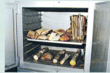
FIG. 4. Estufa elétrica com circulação de ar para secagem de material botânico e amostras de madeira.

A secagem pode ser realizada ao sol, ou, o que é muito melhor, sobre o calor de fogões a querosene ou outra fonte de calor. Os coletores profissionais, geralmente, utilizam no campo, fogões a querosene, sobre o qual colocam a prensa circundada por cortina de lona como proteção contra o vento e a perda de calor.