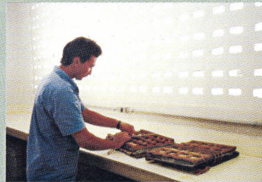
FIG. 3b. Prensagem do material botânico para secagem.