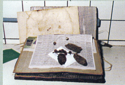
FIG. 3a. Amostra botânica disposta no jornal para secagem na estufa.

As folhas de alumínio corrugado são dispostas após as de papelão e devem ser distribuídas com as canaletas na mesma direção para facilitar a passagem do ar. As prensas de madeira destinam-se a prender as pilhas formadas pelos jornais contendo os exemplares intercalados com papelão e folhas de alumínio, as quais devem ser amarradas com corda de sisal ou a náilon.