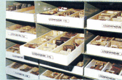
FIG. 5. Amostras de madeira arquivadas na Xiloteca.

A Xiloteca, da Embrapa Amazônia Oriental abriga uma valiosa coleção de madeiras amazônicas, servindo de subsídio à identificação botânica de árvores, arbustos, cipós e, mais especialmente, de madeiras comerciais.