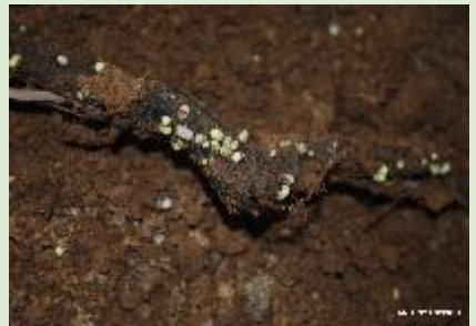
Figura 1. Cistos da pérola-da-terra em raiz de videira.

A pérola-da-terra Eurhizococcus brasiliensis (Hempel) é uma cochonilha subterrânea que ataca raízes de plantas cultivadas e silvestres (Figura 1). O inseto somente é prejudicial na fase jovem (ninfas), visto que os adultos são desprovidos de aparelho bucal. A cochonilha reproduz-se através de partenogênese telítica facultativa apresentando uma geração por ano (Figura 2). A sucção da seiva efetuada pelo inseto nas raízes provoca um definhamento progressivo da videira, com redução da produção e conseqüentemente a morte das plantas. No caso de novos plantios, no primeiro ano o vinhedo desenvolve-se normalmente; a partir do segundo ano, a brotação é fraca e desuniforme, ocorrendo a morte das plantas geralmente no terceiro ano. Plantas adultas, normalmente resistem mais à infestação da cochonilha por possuírem o sistema radicular mais desenvolvido.