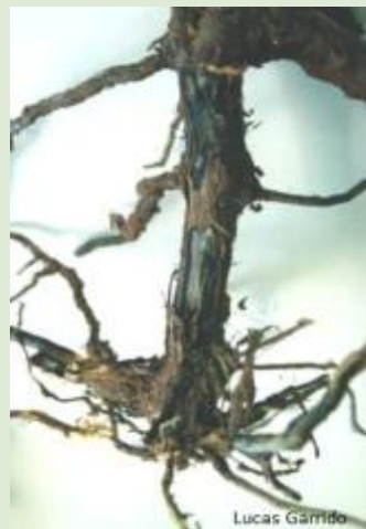
Figura 3. Planta com sintoma do pé-preto ("Black foot") causada pelo fungo Cylindrocarpon spp.

Nos primeiros anos, caso o produtor queira cultivar outras espécies para aproveitar o terreno no interior do parreiral, deve utilizar culturas anuais não hospedeiras da praga, como o alho e o feijão. É comum produtores cultivarem espécies como a batata-doce ( Ipomoea batatas ) ou plantarem figueiras ou roseiras nas bordas, visando aproveitar o espaço. Estas espécies permitem a multiplicação do inseto e o aumento da população da praga na área, sendo responsáveis pela reposição do inseto que atacará as plantas de videira.