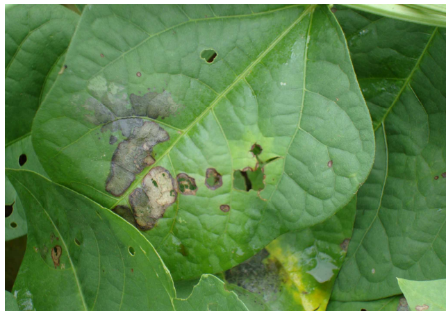
Figura 1. Folhas de feijão caupi apresentando sintomas iniciais de mela.

Segundo Nechet e Halfeld-Vieira (2006), os sintomas da mela surgem nas folhas mais próximas ao solo, onde são encontradas manchas de formato irregular, inicialmente aquosas, mais claras no centro e delimitadas por uma borda escura (Figura 1).