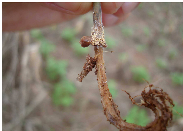
Figura 4. Presença de microescleródios sobre caule de planta de feijão caupi com sintomas de mela.

No caule da planta, observa-se descortiçamento do tecido e, em condições de alta umidade, a presença de microescleródios, de cor creme (Figura 4).