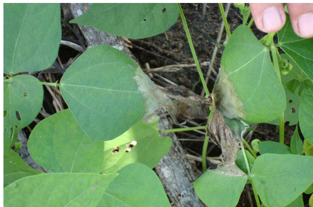
Figura 2. Folhas de feijão caupi com aspecto encharcamento (“meladas”) aderidas umas às outras pelo micélio de T. cucumeris .

À medida que a doença evolui, observa-se o aumento do tamanho das lesões o surgimento de lesões grandes, partindo do bordo das folhas, de aspecto aquoso (Figura 2). Na fase do ataque do patógeno surgem lesões necróticas, de aspecto ressecado e, em alguns casos, é possível observar a presença de micélio (corpo do fungo) aéreo, ligando uma folha atacada à outra e estas têm aspecto de “meladas” (Figura 3).