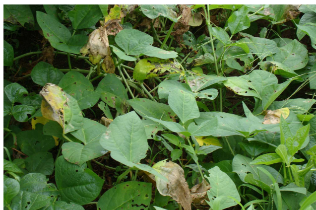
Figura 3. Estágio final do ataque. Necrose acentuada dos tecidos, muitas folhas atacadas.

No caule da planta, observa-se descortiçamento do tecido e, em condições de alta umidade, a presença de microescleródios, de cor creme (Figura 4).