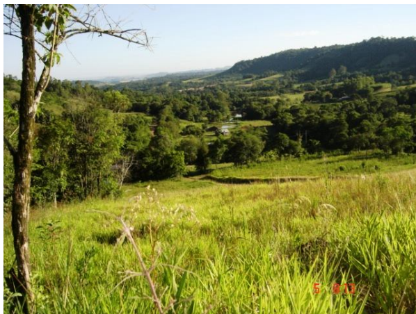
Fig. 1: Vales largos com vegetação parcialmente removida com espigões degradados no vale rio da Várzea (processos erosivos antigos).