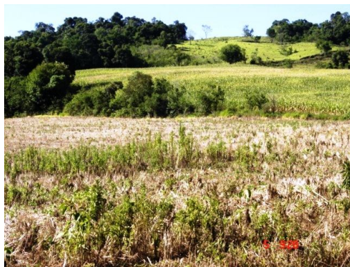
Fig. 9: Início da formação de ravinas com a vegetação de mata e os campos de savana com cultivos na borda do planalto.

Estas terras comportariam alguns cultivos perenes específicos e silvicultura, em uma agricultura não tecnificada (classe VII-1se de capacidade de uso das terras). A situação vigente, que tende a se perpetuar, é a de uma agricultura de pequenos camponeses, onde cultivos perenes pouco a pouco poderão ser introduzidos, além dos cultivos anuais necessários à sobrevivência das famílias.