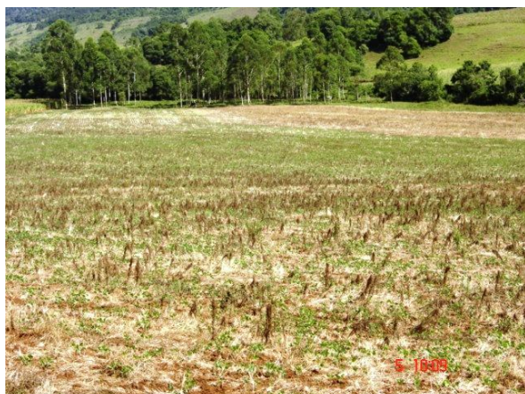
Fig. 3: Cultivos de soja nas bordas das chapadas remodeladas pela erosão com sulcos iniciais com mata nativa.

solos, no geral, estão sendo denominados de nitossolos vermelhos eutróféricos e raros distroféricos, devido à atividade baixa das argilas e a estrutura em blocos subangulares ser moderada a fraca ( Tabela 1 e 2 ) e ( Fig. 3 a 7 ). Raras encostas próximas aos vales depressivos, onde a meteorização foi menor, possuem argilas de atividade alta, e os solos são mais estruturados (luvisolos crômicos). É onde ocasionalmente ocorre, como propõe Klamt (1969), a unidade Ciríaco.