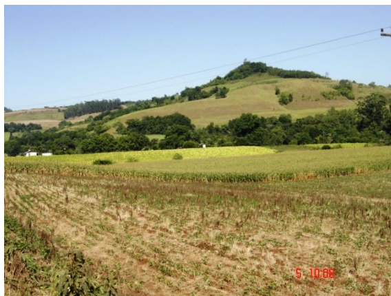
Fig. 4: Bordas do planalto com chapadas remodeladas e restos de chapadas residuais ( inselbergs ) que não foram erodidas.