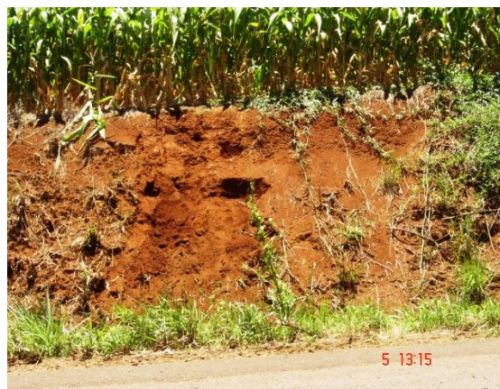
Fig. 5: Vale com cultivos nos sopés das encostas com solos incipientes e cascalhentos (CAMBISSOLO HÁPLICO Ta Eutróférico léptico).