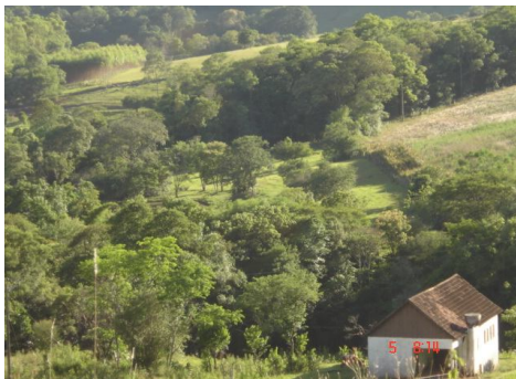
Fig. 10: Encostas das serras com baixos declives na região de vales antigos.

Não há sedimentação coloidal significativa nos vales. Nas encostas em desagregação das rochas, há solos colúviais, alguns pouco profundos e outros, a maior parte, muito rasos, formados por fragmentos das rochas vulcânicas moles, que se misturam nas bordas rochosas com cascalhos, calhaus, pedras e rochas mais endurecidas de basalto, andesitos e riodacitos, à medida que vão rolando pelas íngremes encostas. Os declives são muito altos (>45%) e muito variáveis, podendo, poucos, formarem bordas mais aplainadas no sopé das encostas. São formas de relevo inclinadas e rochosas que compõem a rede de drenagem próxima do rio Uruguai, onde aumenta a carga hidráulica dos drenos naturais. No geral, há poucas e estreitas superfícies aplainadas no fundo dos vales que foram menos dissecados. Nessas ravinas os produtos finos (argilosos) dos processos erosivos naturais acelerados são transitórios ( Fig. 10 e 11 ).