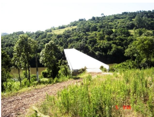
Fig. 12: Ponte sobre o rio Várzea, em vales muito aplainados no contato com os municípios de Cristal do Sul e Ametista.