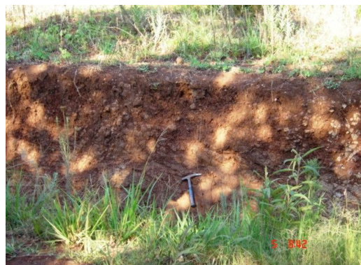
Fig. 8: Solos rasos dos espigões (neossololítico eutrófico fragmentário) em superfícies já cultivadas.

Nesta unidade de relevo, desde o topo até a borda das encostas laterais, são encontradas, predominantemente, variações de neossolos litólicos e regolínicos com grandes grupos dos eutróficos e chernossólicos. Estes solos com características intermitentes muito próximas do A chernozêmico (horizonte "mollic") descrito por Klamt (1969), e dos altos teores de cascalhos da parte inferior (horizonte C), são definidos nos subgrupos como fragmentários ou chernossólicos (Fig. 8 e 9).