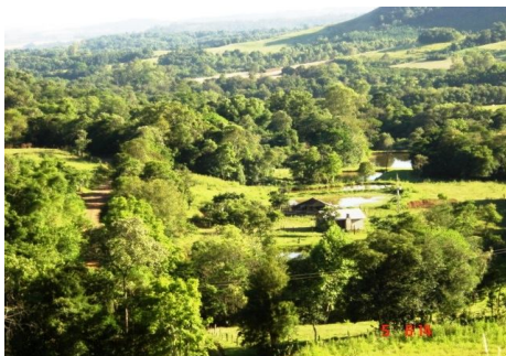
Fig. 11: Serras íngremes com ravinas rochosas onde se desagregam os espigões.

Devido às deposições de camadas de rochas vulcânicas serem estratificadas e com grau de dureza diferenciado, inicialmente os processos erosivos naturais criam contrastes como degraus na superfície da encosta, à medida que o vale está sendo aberto separando espigões e rompendo o planalto. No geral, criam-se inicialmente encostas ásperas e rochosas, alternadas com outras poucas mais lisas à medida que os cortes vão envelhecendo com depósitos de sedimentos. Saltos bruscos nas corredeiras (lajeados) dos vales são efeitos das altas cargas hidráulicas alternadas.