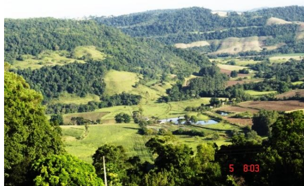
Fig 2: Contraste da savana antiga (hoje cultivada) com mata em regressão no relevo dissecado.

Atualmente, há o domínio de arbustos de espécies mais resistentes a esse intensivo desmatamento para se estabelecer áreas para culturas. Nos vales dos rios, IBGE (1986) considera que os restos da Floresta Estacional Decidual Submontana sejam contínuos.