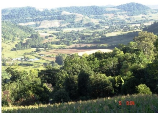
Fig. 13: Vales depressivos do rio Várzea sobre solos muito férteis cercados por espigões em desagregação (aplainados).