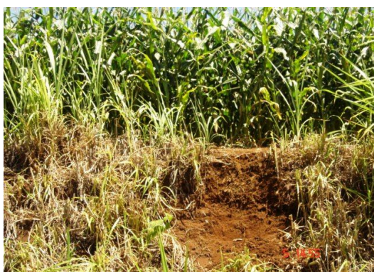
Fig. 14: Solos das encostas e de bordas de vales onde há deposições coluviais (CAMBISSOLOS HÁPLICOS Ta Eutroférricos lépticos)

Nas encostas que margeiam os vales estreitos os cortes são quase retilíneos, com declives muito altos no encontro com o espigão no início da drenagem natural. Atualmente, há pouca contenção de sedimentos no fundo dos vales estreitos, à medida que os lajeados (pequenos riachos) se aproximam do rio Uruguai. São deposições recentes, muito aplainadas, que comportam uma agricultura diferenciada. A tendência natural de todo o processo erosivo é destruir as chapadas e aplainar os vales. Nesse processo destrutivo e construtivo, a meteorização das encostas não tem tempo suficiente para uniformizar todos os parâmetros, em termos das variações químicas e físicas dos solos, como houve em tempos antigos nos solos do planalto. Cada perfil torna-se produto de adições ou remoções suplementares. No local são encontrados luvisolos crômicos órticos fragmentários e cambissolos háplicos ta eutroférricos lépticos.