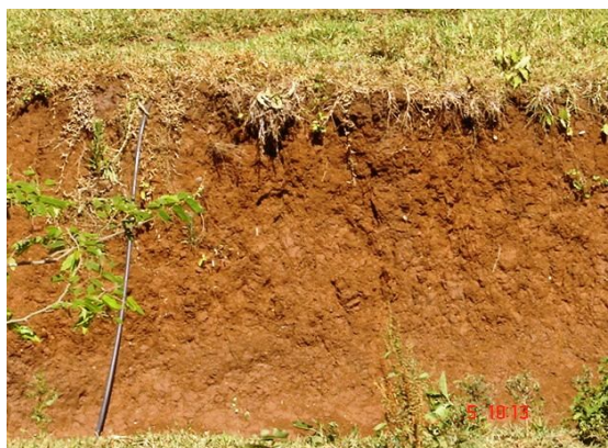
Fig. 6: NITOSSOLO VERMELHO Eutróférico latossólico em chapadas remodeladas (Po) que margeiam planalto nas nascentes do rio Pardo.

Quanto ao uso agrícola, as terras estão situadas como pertencentes à classe II se de capacidade de uso. Os riscos à erosão estão parcialmente controlados com o plantio direto, e as correções de acidez e fertilidade do solo, na sua maior parte, já estão sanadas. As condições climáticas, com estiagens esporádicas durante o verão, são os fatores mais limitantes ao uso destas terras.