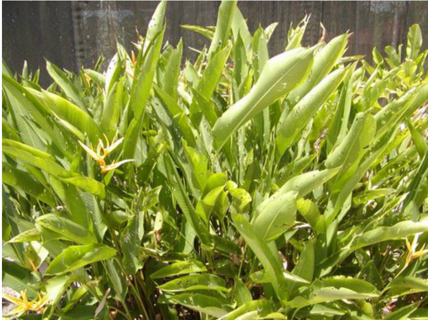
Fig. 2. Plantas de Heliconia sp. livres dos sintomas de sigatoka negra, no campo experimental da Embrapa Amazônia Oriental.