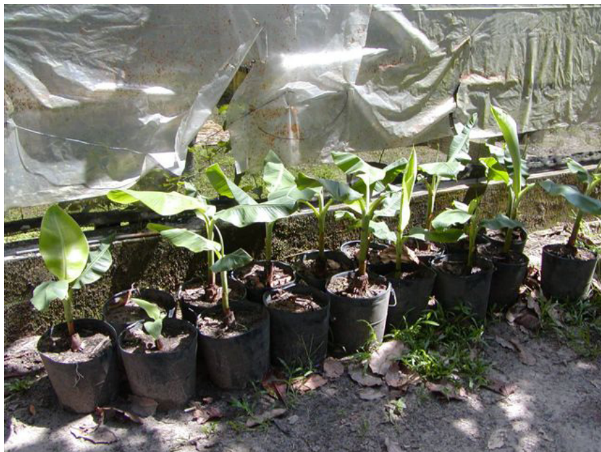
Fig. 1. Mudanças rebrotadas de rizoma aclimatado (cultivar Garantida) provenientes de Manaus, AM, sem sintomas de Sigatoka negra .

Rizomas originais provenientes de Manaus (cultivar Garantida), com folhas rebrotadas, ainda encontram-se na área de viveiro da Embrapa e podem ser observados quanto à sua sanidade pelos órgãos competentes. Após a retirada de mudas para instalação dos experimentos, as folhas que brotaram encontram-se limpas, sem manifestação de sintomas de sigatoka negra (Fig. 2), fato que exclui a possibilidade de introdução da doença via rizoma.