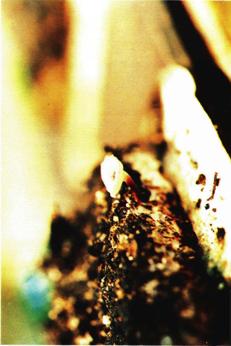
FIG. 1. Basidiocarp de Crinipellis pernicioso do cupuaçuzeiro (isolamento C990) produzido artificialmente em meio de farelo-vermiculita.