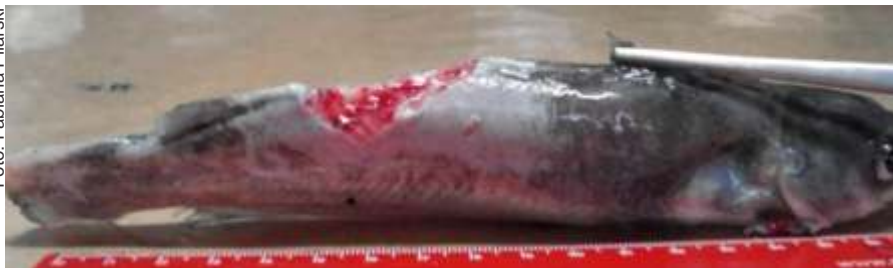
Figura 4. Catfish apresentando sinais clínicos de columnariose. Manchas acinzentadas na região dorsal, caudal e ventral que evoluíram para exposição da musculatura.