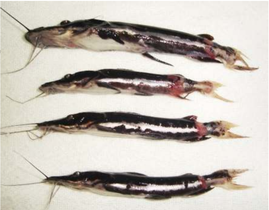
Figura 3. Surubim híbrido com sinais clínicos de columnariose. Ulceração restrita ao pedúnculo caudal com acometimento da nadadeira adiposa e caudal.