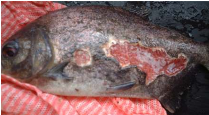
Figura 8. Tambaqui com lesões características de columnariose por todo o tegumento (manchas acinzentadas).