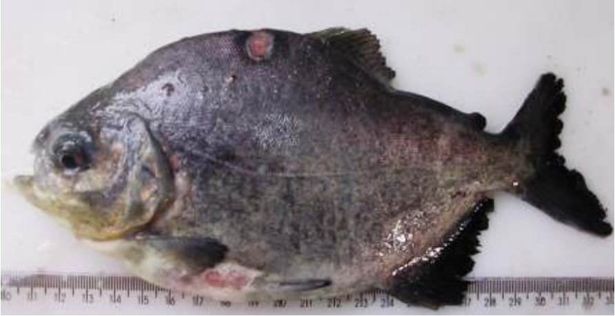
Figura 6. Pacu com início de columnariose. Pequenas lesões de coloração acinzentadas próximo às nadadeiras dorsal e peitoral e também corrosão das nadadeiras.