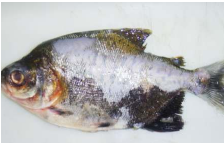
Figura 5. Tambaqui acometido por columnariose exibindo extensa lesão de coloração acinzentada no tegumento, com perda de escamas e corrosão das nadadeiras.