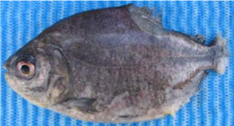
Figura 7. Pacu com sinais clínicos de columnariose. Manchas acinzentadas por toda a superfície corporal e acentuada corrosão de nadadeiras, principalmente caudal e dorsal.