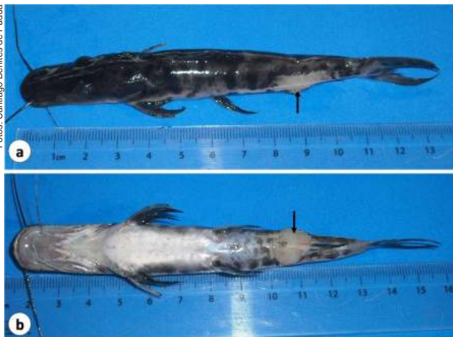
Figura 2. Surubim híbrido juvenil exibindo sinais clínicos de columnariose. Área com perda de pigmentação no pedúnculo caudal (a) e ulceração não hemorrágica no pedúnculo caudal (b).