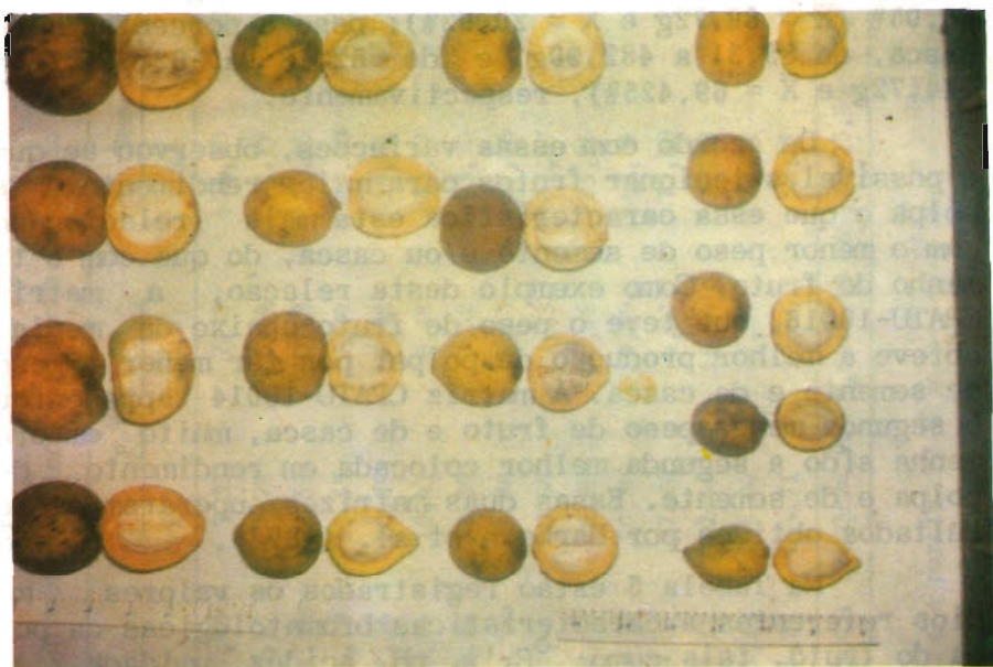
FIG. 4. Variação de frutos de bacurizeiro, Platonia insignis Mart., coletadas na microrregião dos Campos do Marajó (Soure/Salv terra , PA, 1989).

Verificou-se também variação quanto às demais características do fruto de bacurizeiro, como tamanho, coloração e espessura de casca, número de sementes e cor de polpa (Fig. 4).