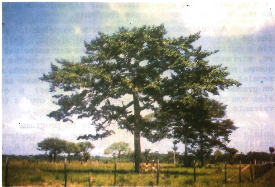
FIG. 1. Exemplos de bacurizeiros, Platonia insignis Mart., na microrregião dos Campos do Marajó (Soure/Salvaterra, PA, 1989).

A área em estudo localiza-se mais a leste, nos limites da costa do oceano Atlântico e da baía do Marajó. Apresenta topografia plana, com algumas formações mais elevadas, denominadas "tesos", cujos desníveis máximos não ultrapassam a 10m. O clima é tropical úmido, temperatura estável com média de 27°C, precipitação média anual de 3.061mm, sendo que 80 a 90% das chuvas ocorrem no período de janeiro a julho. Predomina a vegetação típica de campo (Fig. 1), sendo estas, naturais ou de origem antrópica, conforme a topografia do lugar, vindo em seguida as matas de mangue e terra firme (Organização... 1974).