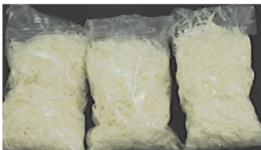
Figura 4. Repolho minimamente processado acondicionado em embalagens plásticas flexíveis de polietileno de alta densidade (PEAD).

O repolho minimamente processado pode ser acondicionado em embalagens flexíveis (Figura 4) ou rígidas, com tampas do mesmo material e que se encaixem perfeitamente ou recobertas com filme plástico esticável, como por exemplo, o policloreto de vinila (PVC). Os sacos plásticos de polietileno de alta densidade (PEAD) e de polipropileno (PP) são apropriados para o armazenamento refrigerado de repolho minimamente processado, por um período de sete dias.