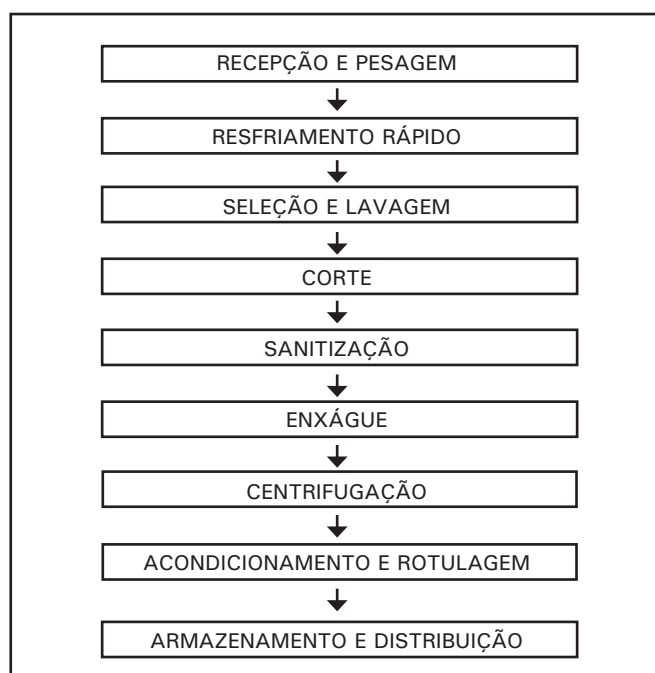
Figura 1. Exemplo de um fluxograma utilizado para o processamento mínimo de repolho.