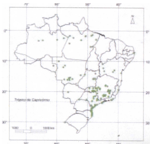
Mapa 1. Locais identificados de ocorrência natural de guanandi ( Calophyllum brasiliense ) no Brasil.

No Brasil, essa espécie ocorre nos seguintes Estados (Mapa 1):