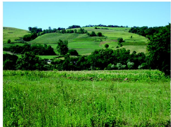
Fig 4: Espigões degradados expandem a agricultura local para além do vale do rio da Várzea.