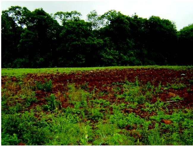
Fig 8 : Solos profundos e férteis na região aplainada do vale do rio da Várzea.