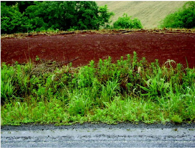
Fig 10: NITOSSOLO VERMELHO Eutrófico luvissólico nas terras aplainadas da bacia hidrográfica do rio da Várzea.