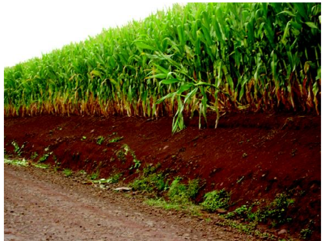
Fig 21: Milho em solos profundos e férteis das terras aplainadas de lombadas e coxilhas.