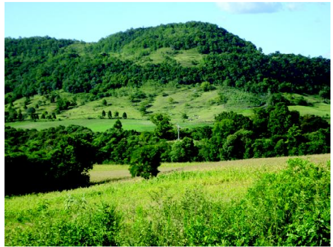
Fig 25: Desmatamento e cultivo nas encostas íngremes dos espigões rochosos.