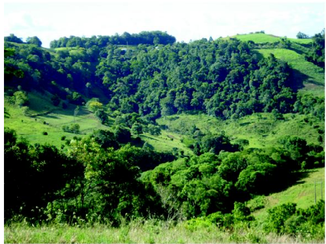
Fig 2: Terras íngremes de serra em processo natural de desmatamento local