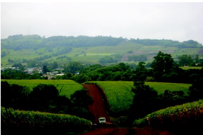
Fig 1: Terras aplainadas pela erosão natural no vale do rio da Várzea.

A história, construída pelos órgãos oficiais e pela população em geral, é rica em detalhes dessa ocupação, no seu aspecto da luta pela sobrevivência dos colonos para arrancar da terra fértil e íngreme o seu sustento e o seu progresso, porém silenciosa em relação aos povos indígenas que as ocupavam. Há um silêncio histórico, onde eles aparecem ocasionalmente nas estradas oferecendo os restos da sua cultura. Há um sentimento de culpa de saber na sociedade que o progresso proposto não caminha com eles pela estrada. Estão nômades sem destino e sem ambições a serem alcançadas.