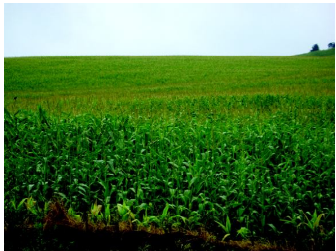
Fig 22: Cultivo de milho em terras aplainadas do vale do rio da Várzea.