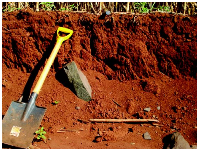
Fig 18: LUVISSOLO CRÔMICO Órtico nitossólico em planícies antigas do rio da Várzea.