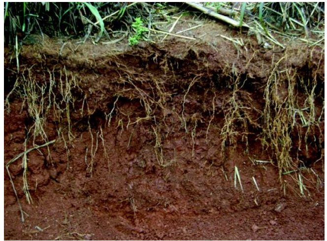
Fig13: CHERNOSSOLO ARGILÚVICO Órtico luvissólico em encostas de serra.