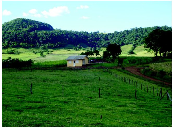
Fig 9 : Estabelecimento de médios proprietários nas terras aplainadas na bacia hidrográfica do rio da Várzea.