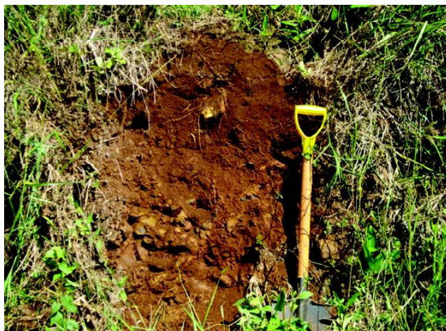
Fig 19: CAMBISSOLO HÁPTICO nas bordas das encostas de serras.