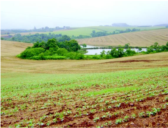
Fig 23: Lavouras cobrem o relevo aplainado (lombadas) com matas e açudes nas depressões.