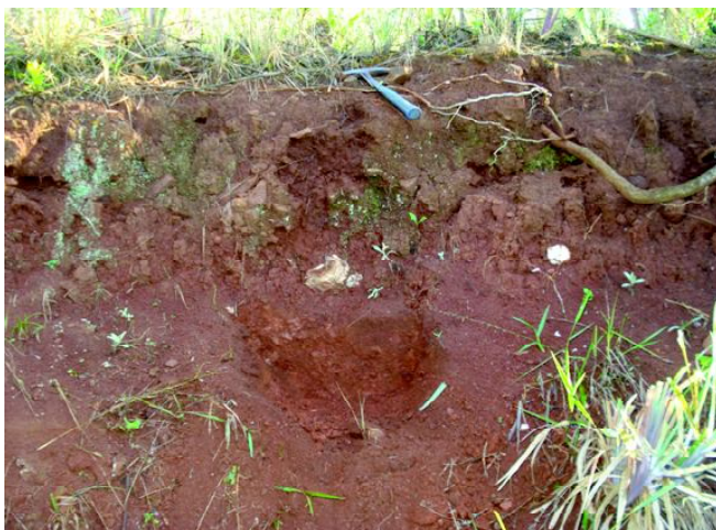
Fig 16: LUVISSOLO CRÔMICO Órtico chernossólico nas terras aplainadas do rio da Várzea.