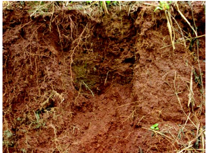
Fig 12: LUVISSOLO CRÔMICO Órtico chernossólico em encosta de espigões degradados.