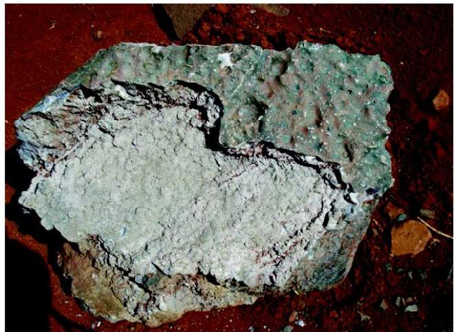
Fig 3: Veios de basalto máfico de ocorrência local no vale do rio da Várzea.