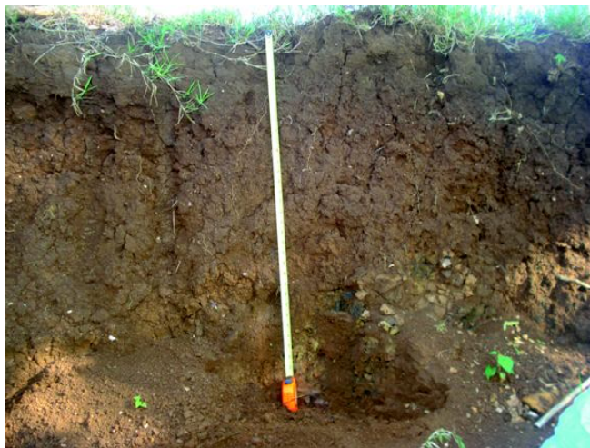
Fig 17: LUVISSOLO CRÔMICO Órtico chernossólico nas terras aplainadas do rio da Várzea.