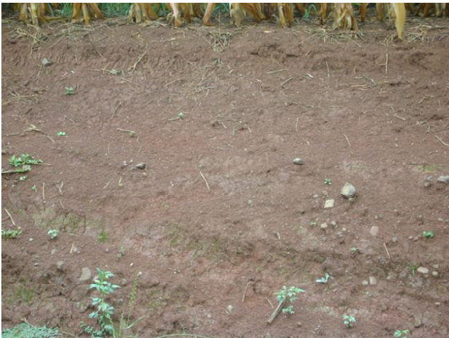
Fig 11: CHERNOSSOLO ARGILÚVICO Órtico luvissólico de ocorrência ocasional nas encostas.