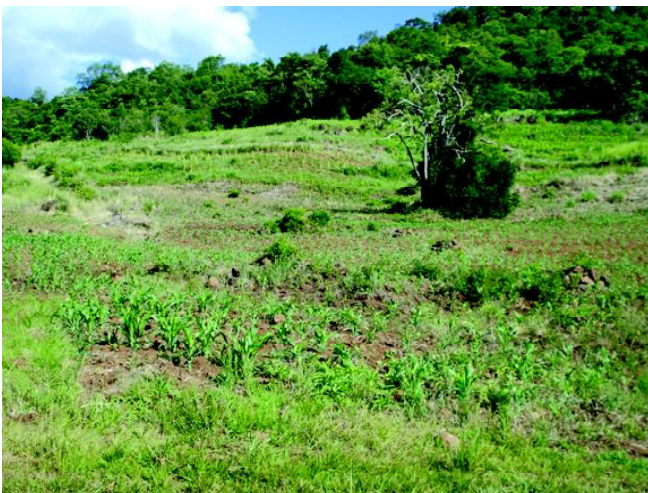
Fig 24: Cultivo de subsistência nas encostas das serras.