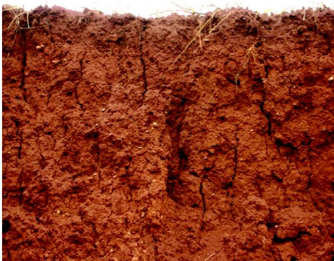
Fig 15: NITOSSOLO VERMELHO Eutroférico luvisólico em espigões degradados.