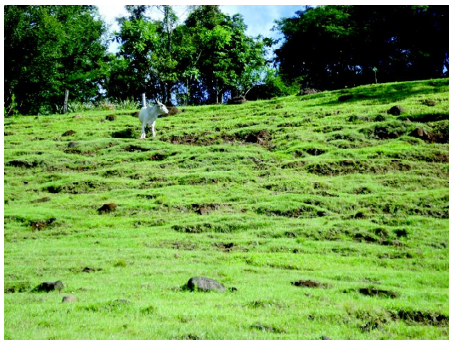
Fig 6: Espigões rochosos em processo erosivo intenso provocado após o desmatamento.