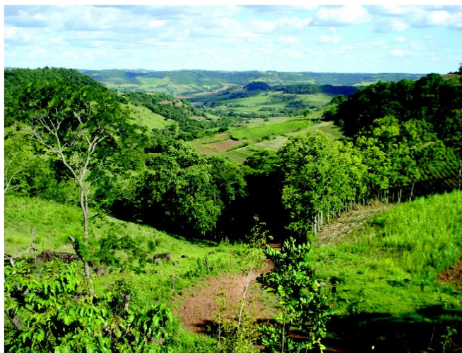
Fig 5 : Espigão rochoso em processo inicial de desmatamento usado com pastagem nativa.

No sistema de aptidão agrícola das terras, de Ramalho Filho e Beeck (1995), essas glebas seriam classificadas como pertencentes ao grupo 2a(b), ou seja, “regular” para pequenos produtores por serem muito férteis (produzem, onde é possível cultivar, boas colheitas sem adição suplementar de nutrientes) e, “restrita” a médios produtores pelas dificuldades impostas ao uso em lavouras mais amplas (pedras, rochas e declives). No geral, essas terras férteis não devem responder à adubação para as médias colheitas de uma agricultura familiar. A água é o fator limitante dos cultivos de verão