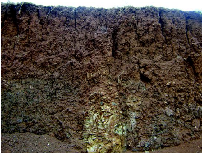
Fig 14: CHERNOSSOLO ARGILÚVICO Órtico luvisólico em encostas ocasionais.