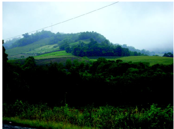
Fig 7: A degradação dos espigões construiu através dos processos erosivos naturais o vale do rio da Várzea.

Nessas condições há, atualmente, pequenas lavouras, que devem ter uso com cultivos perenes nas bordas das encostas. Seriam solos próprios à cultivos esporádicos anuais com um intenso controle da erosão como se recomenda na classes IVse e VIse de capacidade de uso das terras. No sistema de aptidão agrícola das terras seriam do grupo 1Abc, ou seja, "boa" para pequenos produtores, "regular" para grandes e médios produtores. Todas as terras, no geral, são muito férteis, sendo que o fósforo deve ser incorporado apenas para grandes colheitas. Para atividades agrícolas comuns de uma agricultura familiar, os níveis de nutrientes são satisfatórios. Estão sendo cultivadas há um século.