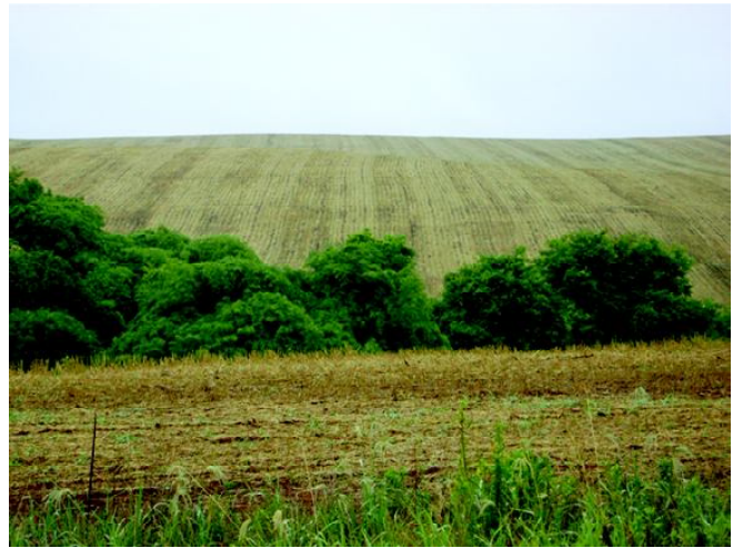
Fig 20: Cultivos intensivos nas terras aplainadas e férteis da bacia hidrográfica do rio da Várzea.

Com isso, as terras podem ser classificadas conforme a Tabela 6. Cabe salientar que os modelos propostos de classificação não produzem "unidades de classes" essencialmente equivalentes, o que pode levar a que ocorram erros ao se estabelecer equivalência entre unidades de capacidade de uso das terras em locais diferentes.