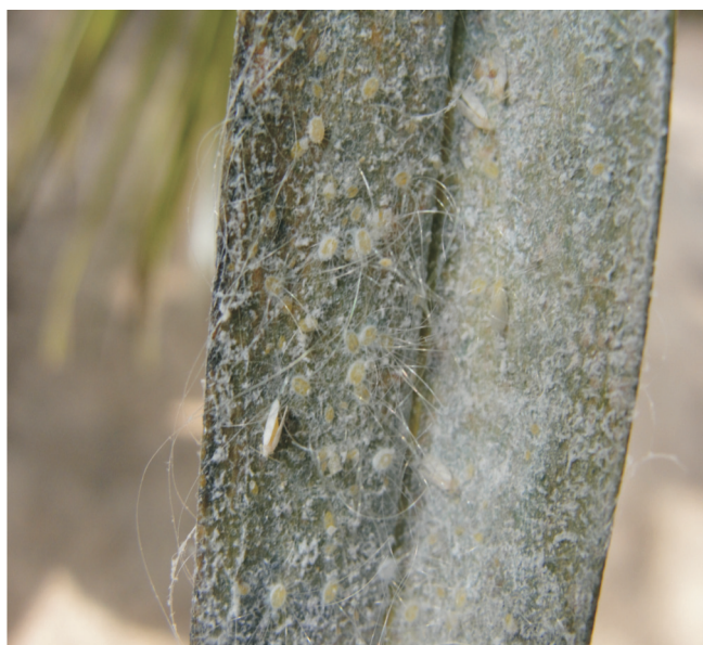
Figura 3. Ninfas da mosca branca Aleurodicus pseudugesii em desenvolvimento na face inferior do folíolo do coqueiro.

Entretanto, há espécies em que os ovos ficam presos ao folíolo por um pedúnculo curto. As ninfas (Figura 3) são translúcidas e de coloração amarelo-clara, sugam a seiva da planta e secretam uma camada branca cerácea que as protegem e passam todo seu desenvolvimento na parte inferior dos folíolos.