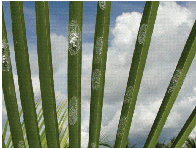
Figura 2. Postura da mosca branca Aleurodicus pseudugesii em formato espiral na face inferior dos folíolos de coqueiro.

Quanto mais quente e seco o clima, menor é o tempo entre a fase de ovo e adulto. A parte inferior dos folíolos das folhas do coqueiro é o local de postura preferido das fêmeas de A. pseudugesii , onde os ovos são colocados formando pequenas espirais (Figura 2).