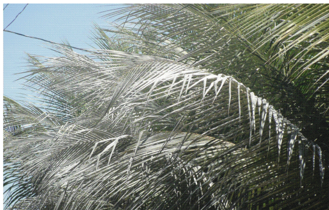
Figura 4. Embranquecimento das folhas do coqueiro devido ao ataque de mosca branca.

O ataque da mosca branca A. pseudugesii em coqueiro é caracterizado por um embranquecimento observado na coroa foliar (Figura 4) em consequência de uma camada branca cerosa que a praga secreta na face inferior do folíolo, seguida pelo desenvolvimento do fungo Capnodium spp. que cobre a face superior dos folíolos com uma fuligem preta conhecida por fumagina (Figura 5).