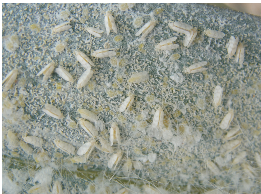
Figura 1. Adultos da mosca branca Aleurodicus pseudugesii em folhelo de coqueiro.

A mosca branca (Figura 1) completa no coqueiro todo seu ciclo de vida, que compreende as fases de ovo, ninfa (4 estádios) e adulto, e dura cerca de 22 dias.