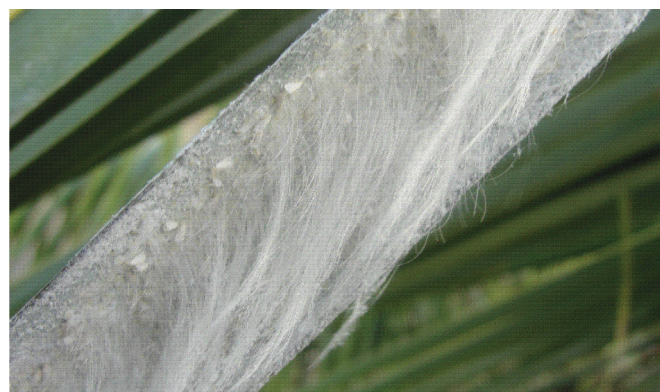
Figura 7. Fios alongados translúcidos e açucarados formados pela mosca branca Aleurodicus pseudugesii na face inferior do folíolo do coqueiro.

As ninfas da espécie M. bahiensis secretam sobre si pequenos flocos brancos individualizados (Figura 8).