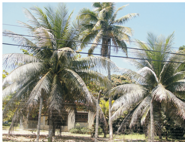
Figura 12. Forte ataque da mosca branca Aleurodicus pseudugesii em áreas residenciais.

Em plantios ainda jovens e em mudas, a praga pode ser combatida com uma mistura de óleo de algodão bruto a 2% + detergente neutro a 1% ou utilizando óleos vegetais emulsionáveis que se encontram disponíveis no mercado, e na mesma concentração. Pulverizações quinzenais são requeridas para eliminação dos adultos emergentes e realizadas sempre nas horas mais amenas, com menos vento e dirigidas para a face inferior dos folíolos das folhas infestadas.