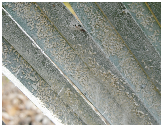
Figura 11. Alta densidade populacional da mosca branca Aleurodicus pseudugesii na face inferior dos folíolos do coqueiro.

forma ao secretar uma camada branca cerosa na face ventral do folíolo para proteger suas ninfas; sua ocorrência em áreas povoadas, incluindo residências, chácaras e condomínios (Figura 12), entre outros.