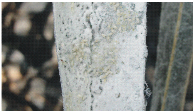
Figura 6. Camada cerácea branca formada pela mosca branca Aleurodicus pseudugesii na face inferior do folíolo.

Pantas sujeitas à alta infestação ficam com a face inferior dos folíolos coberta por uma camada branca e cerosa (Figura 6) e de inúmeros fios alongados translúcidos e açucarados que se dissolvem ao serem tocados (Figura 7).