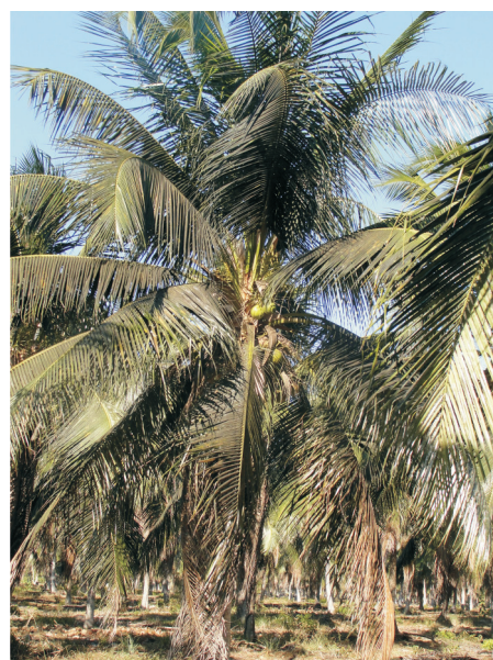
Figura 5. Folhas do coqueiro cobertas pela fumagina devido ao ataque de mosca branca.