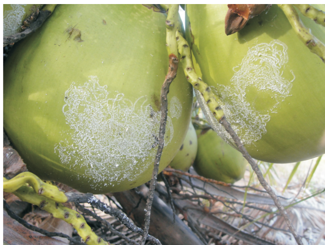
Figura 9. Postura de mosca branca Aleurodicus pseudugesii em frutos de coqueiro.

Essa camada, bem como, os fios ou os flocos produzidos pelas ninfas para se protegerem e a camada de fumagina são barreiras físicas que interferem no processo de fotossíntese da planta, e conseqüentemente, na redução da produção. À medida que o ataque progride e que as folhas vão sendo colonizadas, as posturas passam a ser feitas nas folhas cada vez mais novas e até nos frutos (Figura 9).