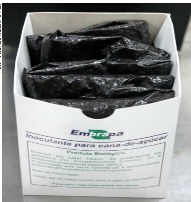
Fig. 1. Inoculante de cana-de-açúcar utilizando turfa como veículo para transporte das bactérias e manutenção da viabilidade das células bacterianas.