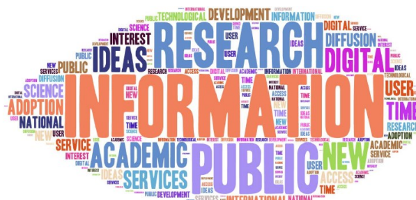
Figura 1 - Nuvem de palavras-chave em inovação em serviços de informação