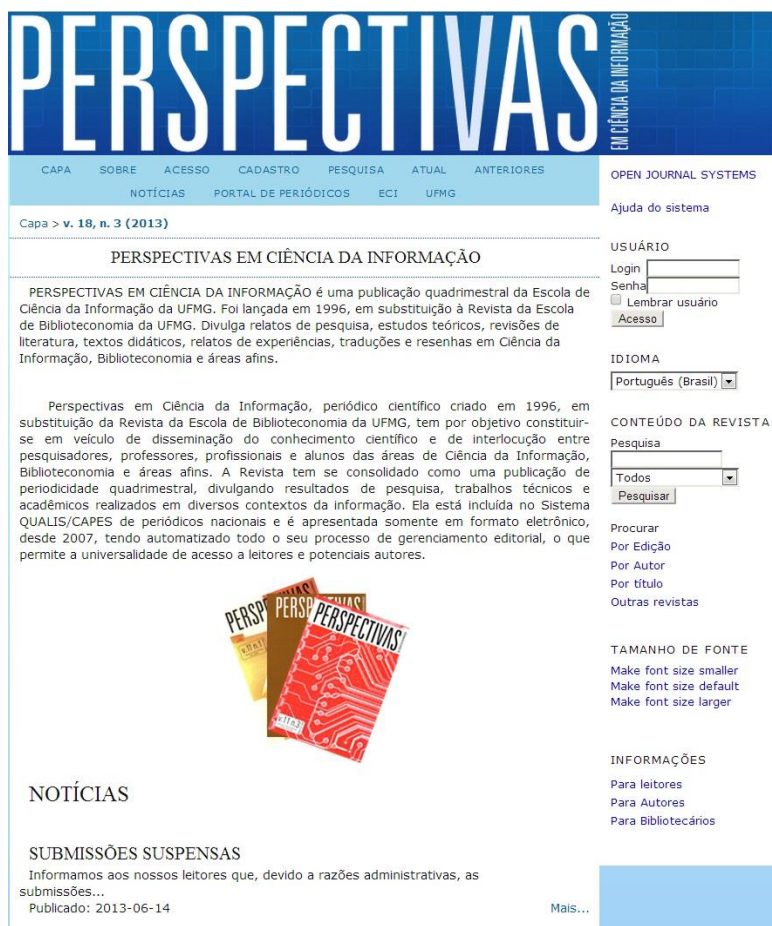
Figura 3 - Interface do periódico Perspectivas em Ciência da Informação

Quanto aos pontos positivos os usuários-autores consideraram que o periódico “Ciência da Informação” possuía uma interface mais fácil de usar, por não apresentar excesso de informação na página inicial, enquanto que outros consideraram o periódico “Perspectivas em Ciência da informação” mais agradável, com layout mais dinâmico, cuja interface está representada na Figura 3.