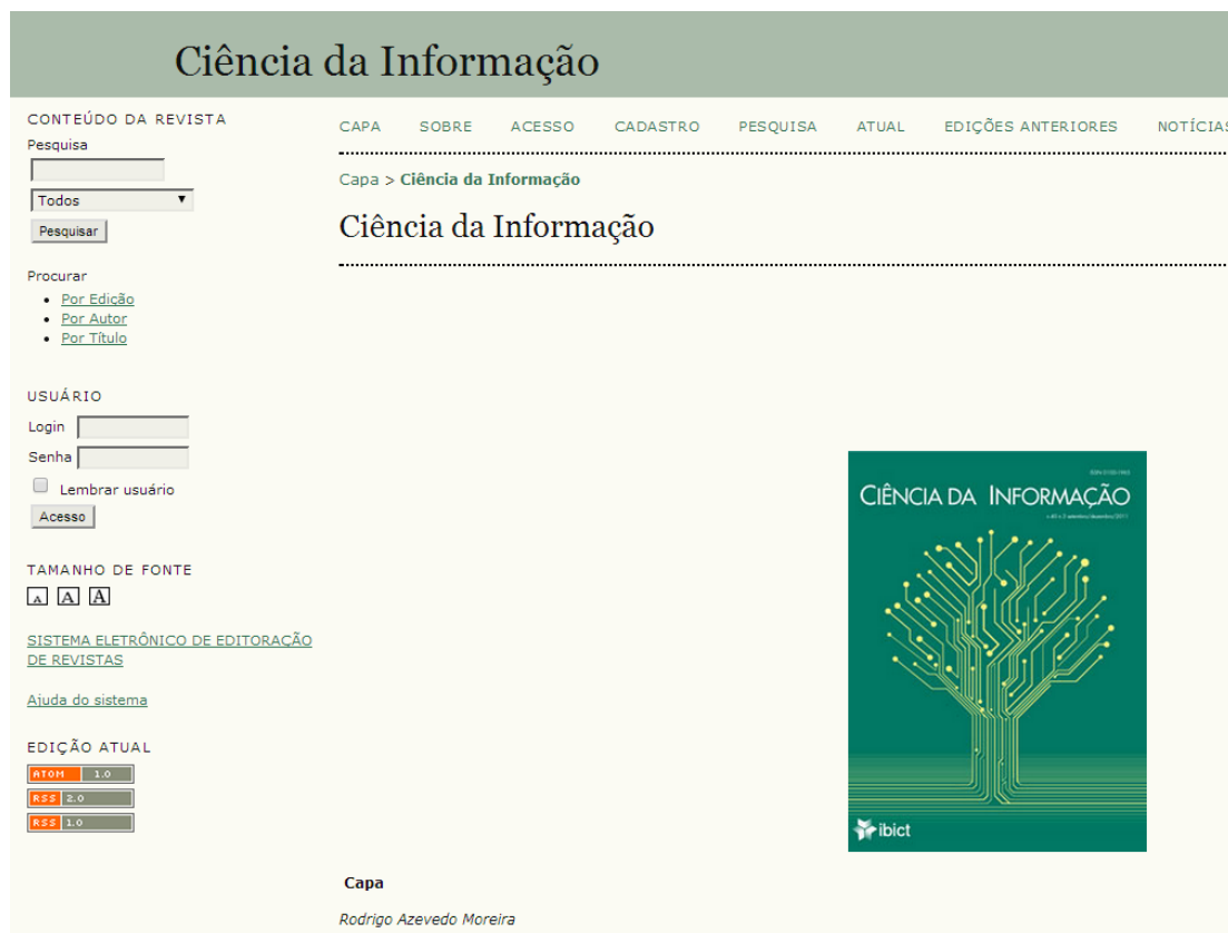
Figura 2 - Interface do periódico Ciência da Informação

A interface apresenta elementos que possibilitam a localização do usuário durante o acesso a todas as possibilidades da plataforma, pois os menus estão presentes em todas as páginas do periódico. Podemos destacar que no periódico Ciência da Informação , cuja interface é ilustrada na Figura 2, a única ocorrência em que os menus não estão disponíveis é no layout de leitura, pois a visualização é por meio de uma página de PDF.