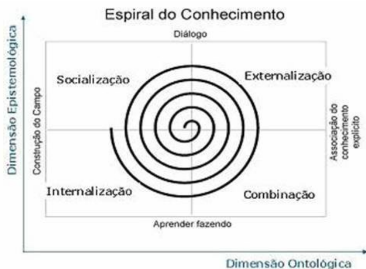
Figura 1 – SECI (Nonaka e Takeuchi, 1995).

Desse modo, o projeto do Núcleo de Gestão da Informação e inteligência da ESDEP tem como fundamentação as categorias de compreensão da espiral do conhecimento de Nonaka e Takeuchi (1995), entendendo que a criação do conhecimento é um processo contínuo de interações dinâmicas entre o tácito e o explícito.