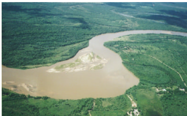
Trecho médio do rio Taquari, abaixo da Est. 5.

Um bom exemplo, é rio Taquari, um dos maiores tributários da bacia do alto rio Paraguai (Brasil; 1997). A bacia hidrográfica do rio Taquari está localizada entre as latitudes de 17°00'00''S e 20°00'00''S e as longitudes de 53°00'00''W e 58°00'00''W, abrangendo uma área de aproximadamente 65.023 km 2 , dentro da bacia do Alto Paraguai (BAP). No fim do alto curso, o rio Taquari recebe o rio Coxim com seu afluente, o rio Jauru, e logo depois, entra na planície Pantaneira. No Pantanal, o rio corre num leito elevado de tal forma que derrama suas águas para a planície adjacente, que tem a geomorfologia de um leque aluvial (Carvalho, 1986). No baixo curso, abre-se em inúmeros canais perdendo água para a planície (Brasil, 1979).