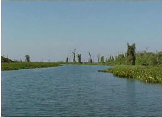
Rio Taquari próximo à Estação 9.

Do montante da carga poluidora orgânica encontrada nesta bacia 73,5% são de origem doméstica e 26,5% de origem industrial (laticínios, frigoríficos e criação de suínos) (Mato Grosso do Sul, 1995). A carga orgânica e os resíduos resultantes de fertilizantes podem chegar aos rios próximos aumentando os níveis de nutrientes na água.