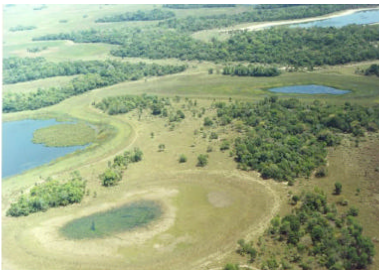
Fig.1. Vista área parcial da sub-região da Nhecolândia durante o período seco, onde são visualizadas as principais unidades de paisagem/fitofisionomias.

A medição de um ou mais atributos (propriedades) da vegetação a médio e longo prazo possibilita a interpretação da resposta animal, verificação dos efeitos de manejo, determinação do potencial de produção de forragem, obtenção de estimativa da capacidade de suporte, etc. As propriedades/atributos geralmente medidos são: fisionomia, estrutura, função e composição (Norbury e Sanson, 1992), cujas mensurações podem ser quantitativas e qualitativas. Dentre os atributos a composição descreve o arranjo das espécies em determinadas áreas, sendo considerada a melhor variável para identificar sítios ecológicos (Nascimento Jr., 1991).