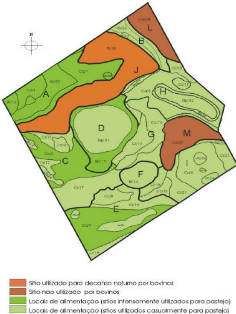
Fig. 3. Área de estudo (151 ha), sub-região da Nhecolândia, estratificada em 12 áreas de utilização (A-M) e 32 sítios (1-32). Os sítios correspondem às unidades de paisagem (FS= floresta semidecídua; Ce= cerradão; Cc= campo cerrado; Ca= campo limpo; Cr= caronal; lbp= interior da baía permanente; Bp= borda da baía permanente; Bt= baía temporária; Vb= vazantes e baixadas) existentes em cada área de utilização.