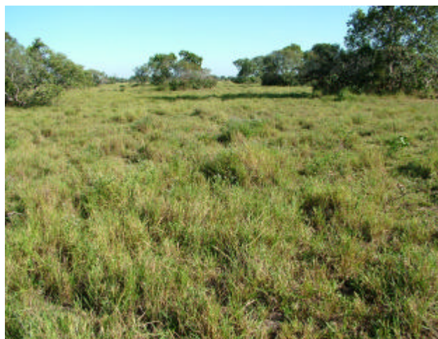
Fig. 2. Pasto plantado em campo nativo mantendo as árvores e capões existentes na área.