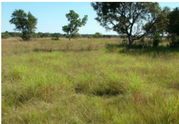
Fig. 6. Caronal, campo com predominância de capim-carona ( Elyonurus muticus ), sub-região da Nhecolândia, MS.