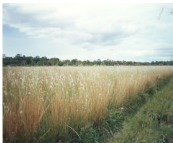
Fig. 1. Campo limpo com predominância de capim-vermelho.

Estudos de Santos (2001) mostraram que os bovinos utilizam apenas cerca de 25% de uma invernada na sub-região da Nhecolândia, Pantanal. Como a distribuição do pastejo é desigual, ocorre a formação de "macegas" (acúmulo de material fibroso não utilizado para pastejo), que são geralmente áreas com predominância de gramíneas cespitosas grosseiras como capim-carona ( Elyonurus muticus ), fura-bucho ( Paspalum lineare ) e capim-vermelho ( Andropogon hypogynus ) (Fig. 1).