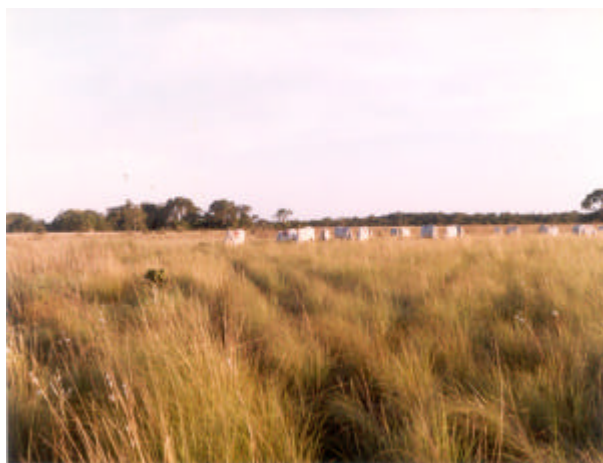
Fig. 7. Campo com predominância de capim fura-bucho ( Paspalum lineare ) e Trachypogon spicatus , sub-região da Nhecolândia, MS.

A opção por essas áreas para a implantação de pastagens de Brachiaria humidicola pode contribuir para a redução de incidência de incêndios, pois apesar dessa espécie não apresentar valor nutritivo elevado, ela tem relativamente menores teores de fibra e apresenta um ciclo de crescimento mais prolongado do que os capins duros (“macegas”) que predominam nesses ambientes.