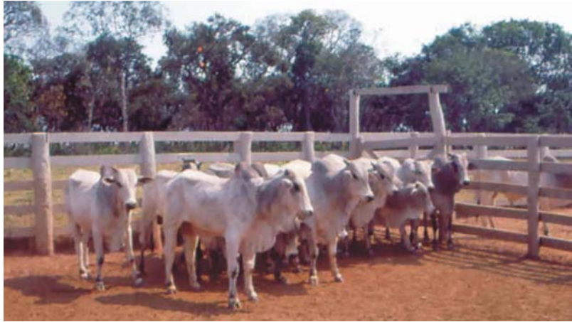
Figura 9. Touros nelore, grupo testemunha (T1), mantidos no Planalto (outubro de 1994).

Touros mantidos no Planalto tiveram desenvolvimento normal (Figura 9), alcançando os maiores valores de peso corporal (491 kg) e altura na garupa (147 cm), sendo todos aprovados no exame andrológico e aproveitados como reprodutores (Tabela 11). Animais transferidos para o Pantanal e alocados para recria em pastagem cultivada de Brachiaria humidicola apresentaram resultados semelhantes quer transferidos aos doze (412 kg) quer aos 24 meses de idade (428 kg). No entanto, touros transferidos aos 24 meses apresentaram melhor aproveitamento para reprodução e maior valor de percentagem de motilidade que os seus companheiros transferidos aos 12 meses.