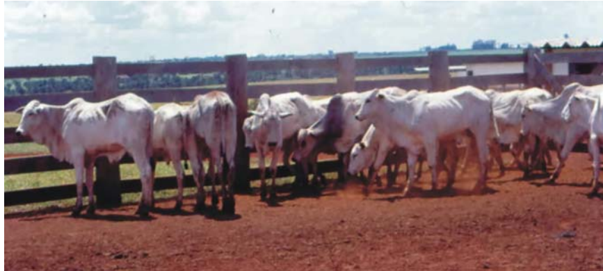
Figura 6. Lote de animais serranos , após a desmama, sorteados para transferência para o pantanal (Faz. Rancho Alegre, Campo Grande, MS, julho de 1992).

T5: Idem III, com transferência aos 24 meses de idade.