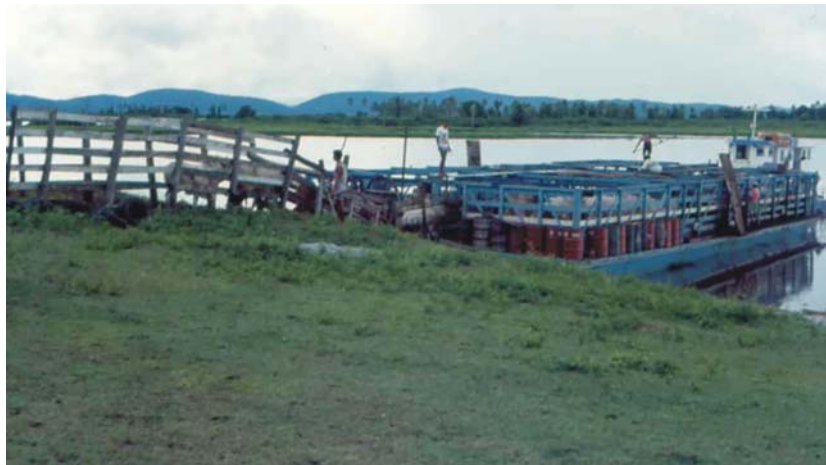
Figura 4. Transporte de animais em navio-boieiro pelo rio Paraguai, Faz. N. Sra. Da Candelária, Baía do Castelo, sub-região do Paraguai.