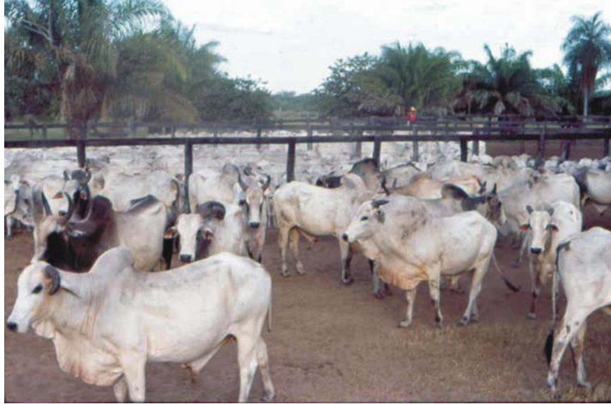
Figura 7. Avaliação final de touros, na fazenda São João do Piquiri, Campo Eunice, Paiguás (maio de 1994)

Os relatos destes trabalhos, detalhados por Rosa et al. (1994a) e Schenk et al. (1994), indicam que, em geral, touros da linhagem Golias foram os que apresentaram as maiores quedas de condição corporal e de qualidade de sêmen, após a utilização em monta natural, em campo nativo. Taj Mahal, por outro lado, foi a linhagem que apresentou a maior facilidade para manutenção das características de condição corporal entre os dois períodos, especialmente pela contribuição do touro Osíris da Terra Boa. De um modo geral, quanto a qualidade de sêmen, peso e condição corporal, Karvadi foi a linhagem que apresentou os melhores resultados, com destaque para as progênes do touro Gim de Garça (Tabela 9).