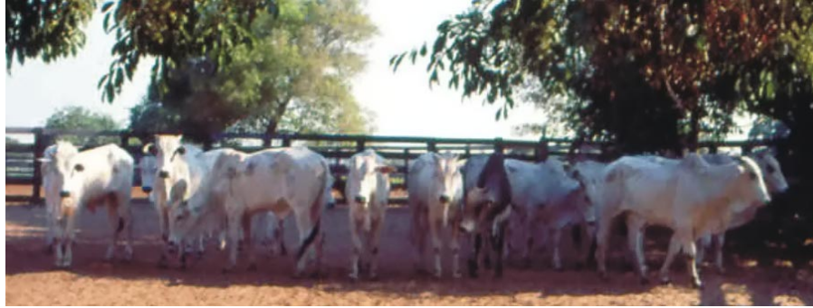
Figura 10. Touros nelore transferidos para o Pantanal aos 12 meses de idade e recriados em campo nativo (outubro de 1994).

Tendo em vista os resultados com relação à altura, peso e escore da condição corporal, a transferência para o Pantanal aos doze meses de idade pode ser interessante por restringir o tamanho adulto dos touros, de forma mais compatível com o tamanho das vacas, no Pantanal, desde que sejam evitados os riscos de mortalidade e minimizados os efeitos negativos dos estresses sazonais das estações de seca e de cheias sobre as características reprodutivas dos animais (Rosa et al., 1996a).