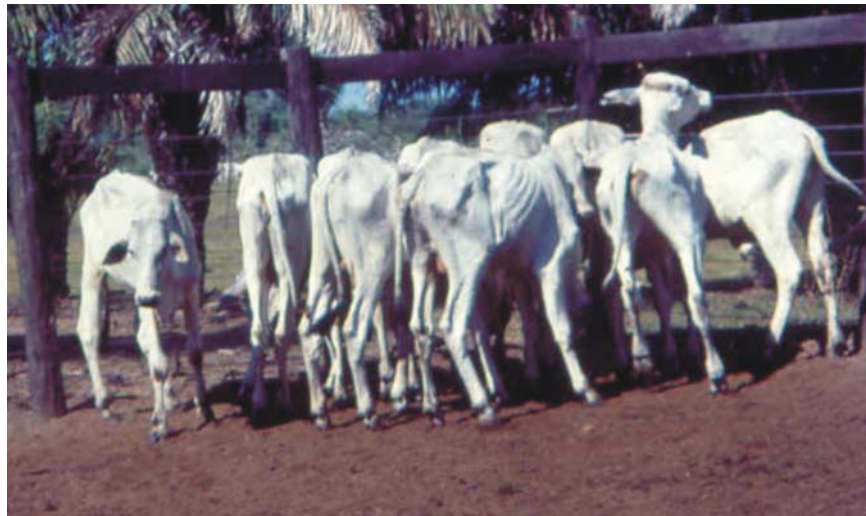
Figura 8. Animais nelore serranos seis meses após a transferência para o Pantanal, com recria em campo nativo (maio de 1993).

* Médias seguidas das mesmas letras não diferem entre si (Duncan, P > 0,05 ).