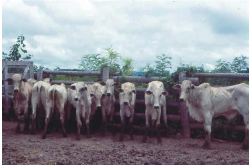
Figura 3. Lote de tourinhos nelore em recria na Faz. N. Sra. Da Candelária, Baía do Castelo, sub-região do Paraguai (janeiro de 1992).