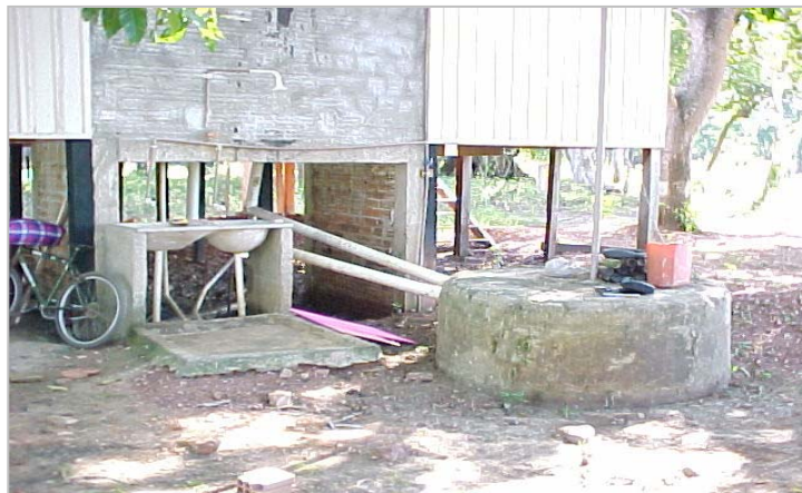
Figura 4. Detalhe do sistema de esgotamento usado pela totalidade dos empreendimentos pesquisados na região de estudo.