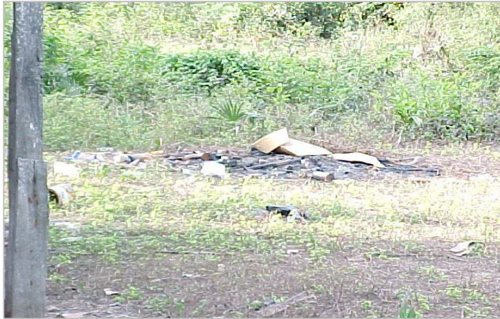
Figura 6. Detalhe do armazenamento de resíduos sólidos domésticos a céu aberto (lixão particular) e posterior queima.

As alterações provocadas pela ocupação da vegetação ciliar, com as construções de habitações, bem como os resultados do seu uso, na forma de efluentes líquidos e resíduos sólidos (lixo) afetam direta ou indiretamente o objeto principal da razão dessas construções, que é a pesca. Algumas espécies onívoras de peixes, como a piraputanga - Brycon microlepis , o pacu - Piaractus mesopotamicus e as sardinhas de água doce do gênero Triporthus sp. , encontradas na planície de inundação do rio Miranda, alimentam-se de itens vegetais provenientes da mata ciliar (flores, frutos e sementes), de crustáceos e outros peixes e de algas e insetos (Resende et al., 2000). As espécies herbívoras como as pacu-pevas (sub-família Myleinae) e ximborés (Família Anostomidae) alimentam-se igualmente também da vegetação inundada nas enchentes (Resende et al., 1998), ressaltando-se a importância da integridade das áreas de preservação permanente, sujeita à inundação, ao longo dos cursos d'água.