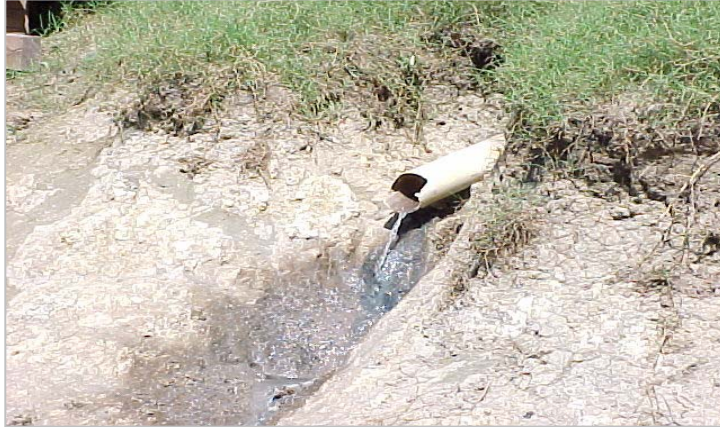
Figura 5. Despejo de efluente líquido doméstico de edificação ribeirinha no rio Miranda, localidade de Salobra.

A água servida de cozinha e de demais usos de lavagem, denominada de água-cinza, aparece em 47% dos ranchos de pesca, despejada diretamente no corpo receptor, o rio Miranda, como pode ser observada na Figura 5.