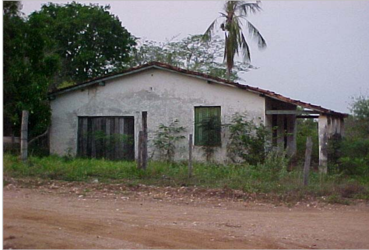
Figura 1. Primeiro rancho instalado na região de estudo na década de 60 em Salobra.

A maior parte dos ranchos de pesca, na região ribeirinha da cidade de Miranda, encontra-se em área de preservação permanente (Tabela 2), perfazendo 63,2%. Essa frequência é um pouco mais reduzida na localidade de Salobra, com 45,7%. Considerando-se as duas localidades, metade dos ranchos encontra-se em área de preservação permanente (49,4%) e a outra metade (50,6%), em condições legais, fora dessa área.