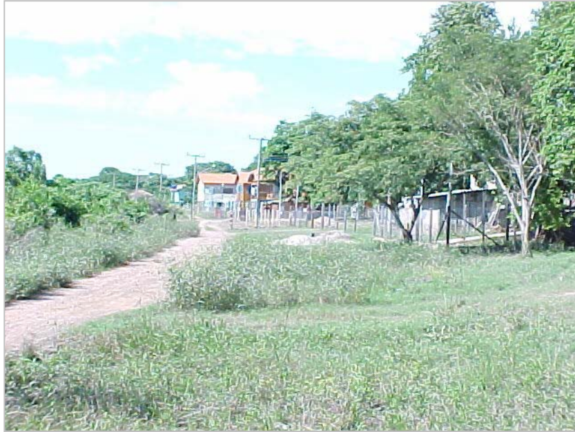
Figura 3. Concentração de ranchos de pesca em área de preservação permanente (mata ciliar), na localidade de Salobra..

peças e despejo de resíduos domésticos na calha fluvial. A Figura 3 é ilustrativa dessa situação.