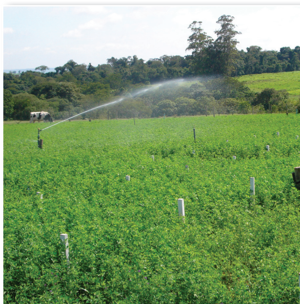
Fig. 1. Vista geral do experimento a campo.