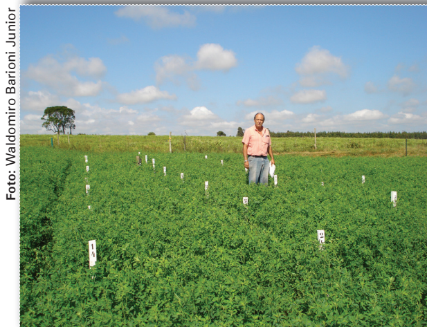
Fig. 2. Vista geral do experimento a campo.

durante os cortes, coletou-se uma amostra das plantas de cada parcela. As amostras foram secadas em estufa na temperatura de 65°C, até peso constante. Na parcela sem capina, durante os cortes 2, 3 e 4, também se determinou a matéria seca da comunidade infestante. Esses dados foram submetidos à análise de variância pelo procedimento GLM do SAS (SAS, 2003). Para a comparação entre médias adotou-se o teste t ao nível de significância de 5%.