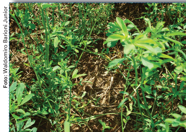
Fig. 3. Efeito do paraquat sobre plantas daninhas.

As médias das avaliações de brotação da alfafa, bem como as de controle e de fitotoxicidade causada pelos herbicidas estão apresentadas na Tabela 3.