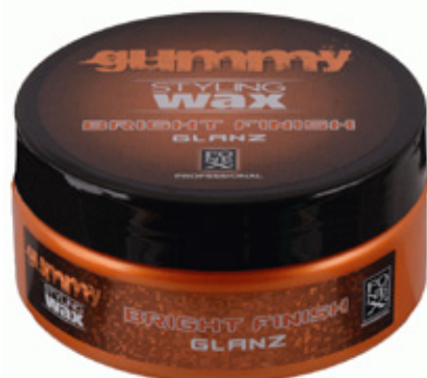
Figuur 1. De door de patiënt gebruikte styling wax voor het haar.

De hier gepresenteerde patiënt had een allergisch contacteczeem door joodpropynylbutylcarbamaat in een styling wax voor het haar. Het eczeem was gelokaliseerd in de handpalmen (waarmee de wax werd aangebracht), op het voorhoofd en in de haargrens, hetzij door onopzettelijke applicatie direct op