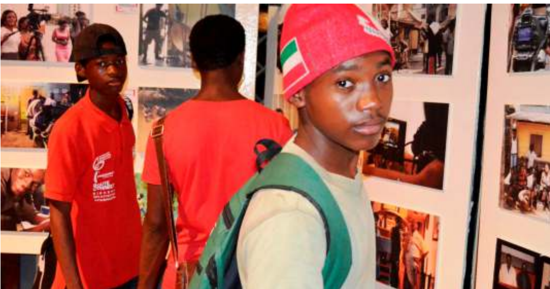
Exposición fotográfica "Guinea Rueda" con imágenes de rodajes que han tenido lugar en Guinea en los últimos años.