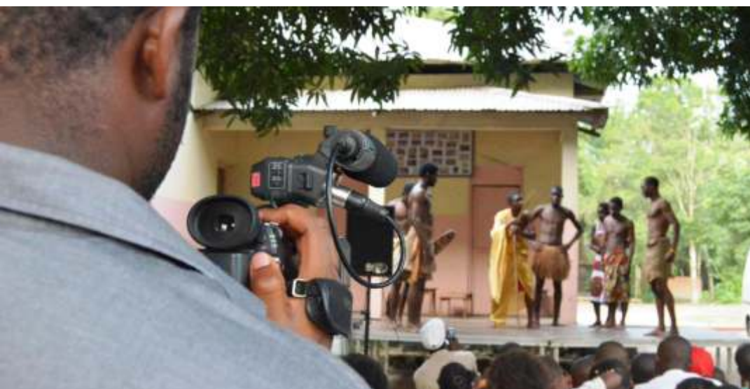
Último día del FECIGE en Bata, con la Cia teatral 7º Arte y su obra "Un pasado"