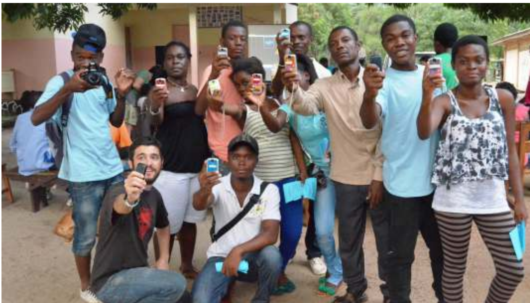
Grupo de alumnos/as del taller de realización audiovisual básica desarrollado durante el FECIGE en Bata