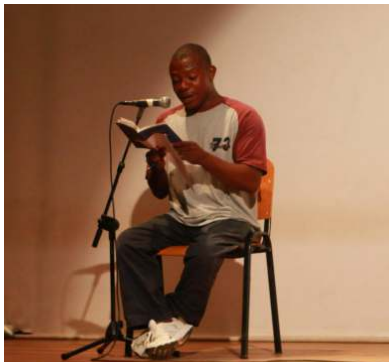
El escritor Mariano Ekomo, condujo la entrega de los galardones del concurso de relato corto y leyó varios de sus relatos pertenecientes al libro "Palabras que no tienen boca"

Fragmento del relato Las crónicas de Musa