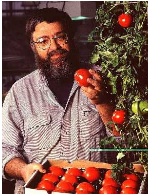
Slika 3- Istraživa s geneti ki modificiranom „Flavr Savr“ raj icom

gena uvjetuju mekšanje ploda ime raj ica postaje nepodobna za duži transport i skladištenje. Ameri ka tvrtka Calgene uspjela je blokirati gen za enzim poligalakturonazu koji razgra uje pektin u stijenci stanice i tako omekšava plod. Time su stvorili novu, geneti ki modificiranu raj icu dužeg trajanja koja je zadržala sve ostale karakteristike, tzv. „Flavr Savr“ raj icu. (Batista, 2009)