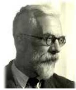
Slika 16. Ronald Aylmer Fisher