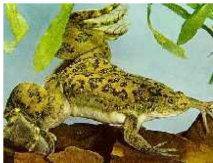
Slika 14. Xenopus laevis D.

Križani su divlji tipovi roditelja, te je nadalje križano i njihovo potomstvo. U 25% križanja recesivni letalni aleli bi se razotkrili kao morfološki mutanti u o ekivanom Mendelovom omjeru. Broj recesivnih letalnih alela u obje vrste ( R = 1.87 za L. goodei i R = 1.43 za D. rerio ) je potpuno jednak onom u Xenopus laevis D. (Slika 14.), koji iznosi 1,875, te je otprilike sredina vrijednosti za vinske mušice ( R = 0,5-3 ). Ta sli nost vinske mušice i kralježnjaka je iznena uju a, pošto je genom vinske mušice puno manji i ima manje gena nego kralježnjaci (Halligan i Keightley, 2003).