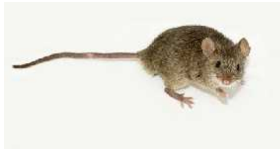
Slika 11. Mus musculus L.

Letalni aleli identificirani u različitim populacijama kućnog miša (Slika 11.) se mogu podijeliti u dvije osnovne grupe između kojih nisu otkrivene nikakve razlike na temelju genetičkih ili embrionalnih kriterija.