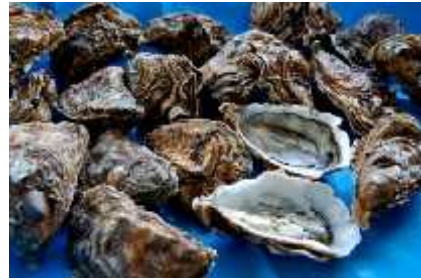
Slika 10. Cassostrea gigas