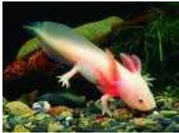
Slika 9. Ambystoma mexicanum

velik broj potomaka, te tako omogu avaju testiranje o ekivanih Mendelovih omjera, pa se i potomstvo koje se ne uspije razviti lako može izbrojati. Teoretska vrijednost R=1,6 odre ena je za vrstu Ambystoma mexicanum (Slika 9.), iako nije bilo mogu e potvrditi tu vrijednost iz originalnih dokumenata. Visoka vrijednost R je utvr ena i za Cassostrea gigas (Slika 10.), iako je bilo predloženo da je odmak od Mendelovih omjera mogu i zbog nekih drugih faktora osim letalnih alela prisutnih u genomu te vrste (Halligan i Keightley, 2003).