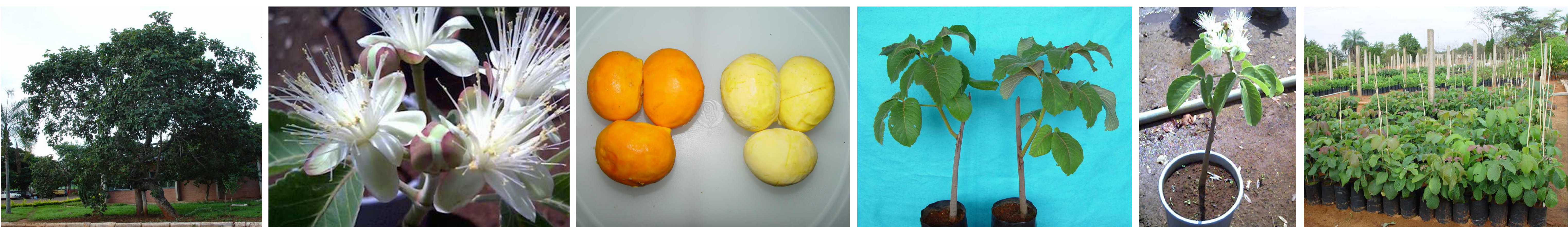
Figura 1. Fotos da matriz de pequi Embrapa Restaurante, flores e frutos do pequi, mudas obtidas via enxertia e viveiro de mudas da Embrapa Cerrados.

Os marcadores RAPD gerados foram convertidos em uma matriz de dados binários, a partir da qual foram estimadas distâncias genéticas entre as matrizes, com base no complemento do coeficiente de similaridade de Nei e Li, utilizando-se o Programa Genes (Cruz, 1997). A matriz de distâncias genéticas foi utilizada para realizar a análise de agrupamento por métodos hierárquicos utilizando como critério o método do UPGMA ( Unweighted Pair Group Method with Arithmetic Mean ) com auxílio do Programa Statistica (Statsoft Inc., 1999).