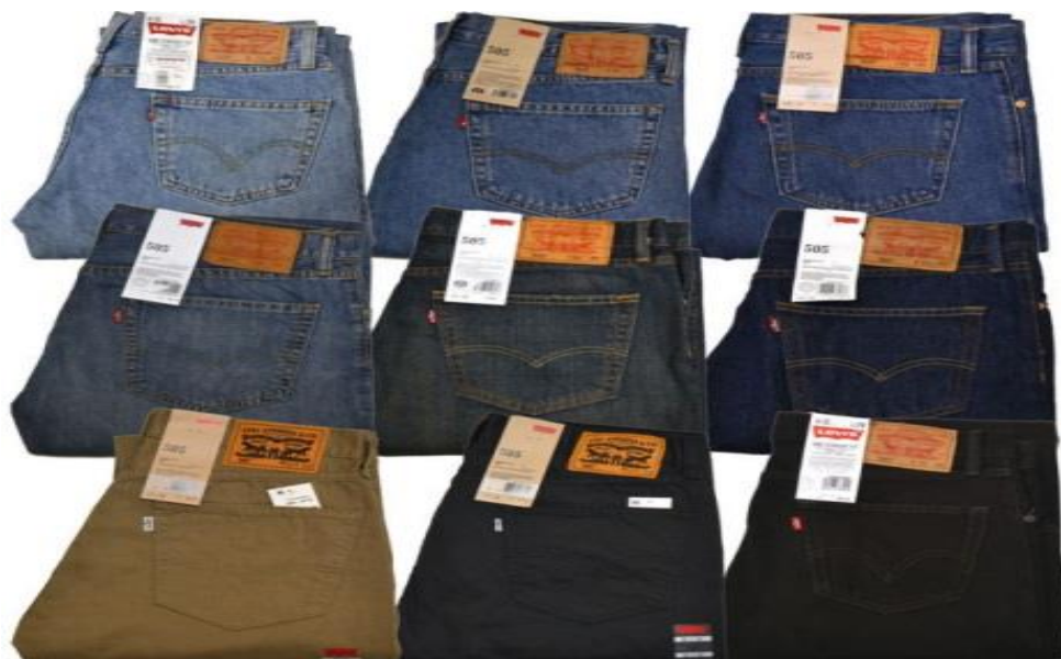
Slika 3. Levi's traperice