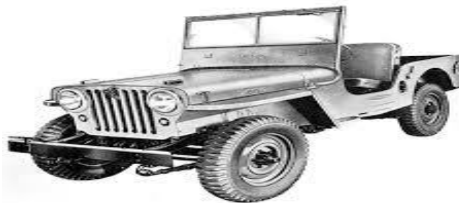
Slika 1. Willys džip