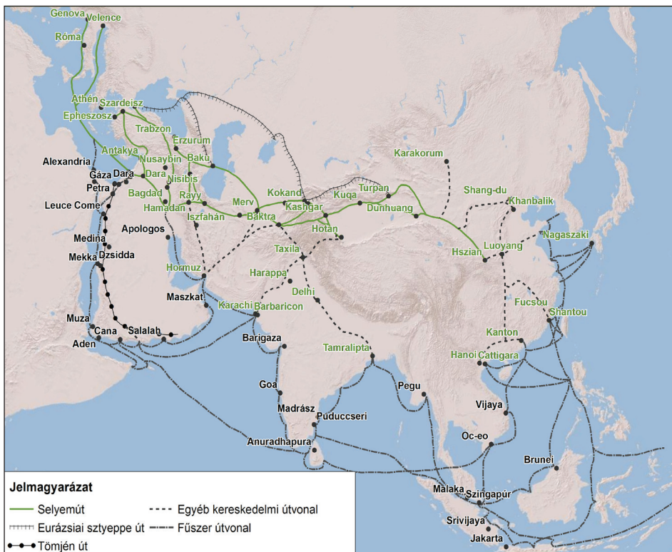
1. ábra: A történelmi Selyemút és a hozzá kapcsolódó fontosabb kereskedelmi útvonalak

Egyesült Államok és Nagy-Britannia politikája, másik pedig a szárazföldi (vasúti és közúti) szállítás tengerivel szembeni gyenge versenyképessége és hatékonysága volt. A XX. század közepére geopolitikai szempontból az USA egyértelműen a világ vezető hatalmává vált, melyben jelentős szerep jutott a világtengerek feletti hatalomgyakorlásának.