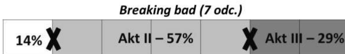
Rysunek 5 Przebieg dramaturgiczny głównego wątku pierwszego sezonu Breaking Bad

na wypadek ewentualnej śmierci (ma zdiagnozowany zaawansowany nowotwór klatki piersiowej). Posiada więc sprecyzowany cel, do którego dąży zmagając się z różnego rodzaju problemami. W kolejnych seriach zdobywanie pieniędzy staje się jego obsesją, co odbywa się kosztem relacji z rodziną, jednak w poniższym opracowaniu będzie przeanalizowany wątek główny pierwszego sezonu.