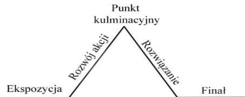
Rysunek 1 Piramida dramaturgiczna Frytaga

w swej teorii budowy dzieła scenicznego stwierdził, że dramat podzielony jest na pięć części, nazwanych odpowiednio : ekspozycją, rozwojem akcji, punktem kulminacyjnym, rozwiązaniem oraz finałem. [Frytag 1896]