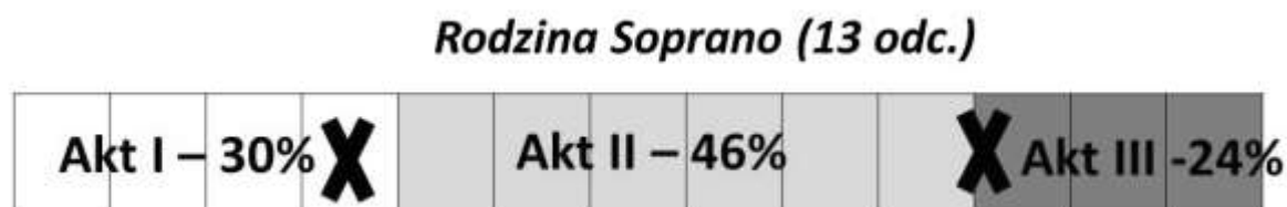
Rysunek 3 Przebieg dramaturgiczny głównego wątku pierwszego sezonu Rodziny Soprano

Poniższy diagram ilustruje rozkład wątku głównego w pierwszym sezonie