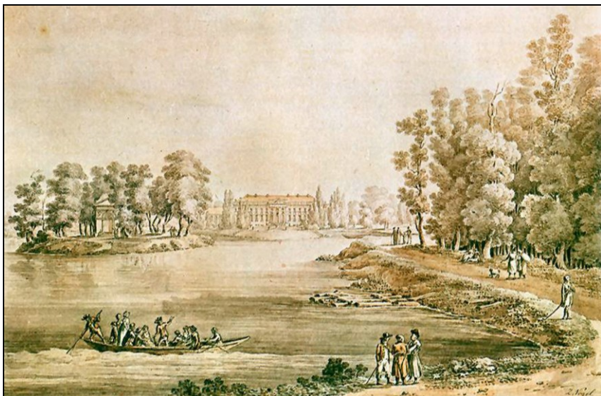
1. Z. Vogel, Widok pałacu w Dęblinie , 1796, MNW ( A. Król, Dęblin, „Przegląd Lotniczy” 1937, nr 10, s. 1329)