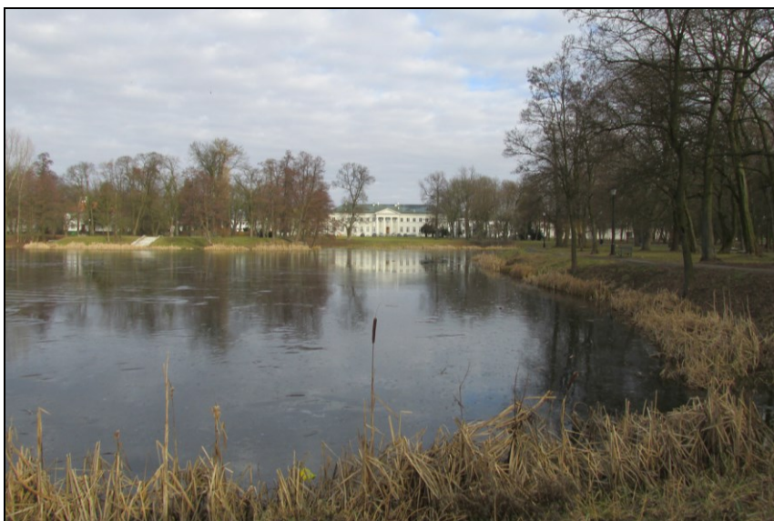
2. Założenie pałacowo-ogrodowe w Dęblinie