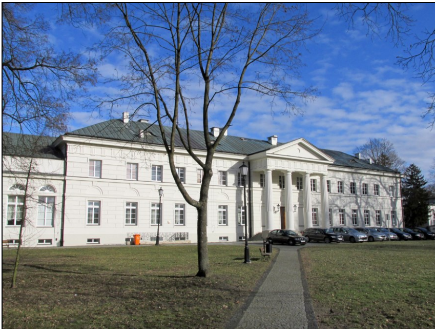
5. Pałac w Dęblinie – elewacja południowa