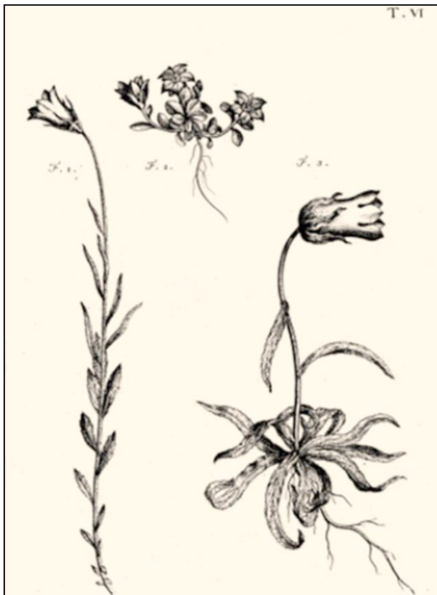
3. C. L. Allioni, Campanula valdensis / cenisia / aplestris (C. L. Allioni, „ Flora Pedemontana ”. T. 1, Torino 1785, il. VI)