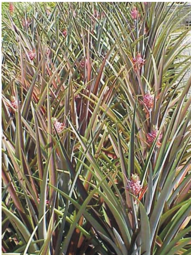
Figura 1. Plantas floridas de Ananas comosus var. erectifolius , em campo.