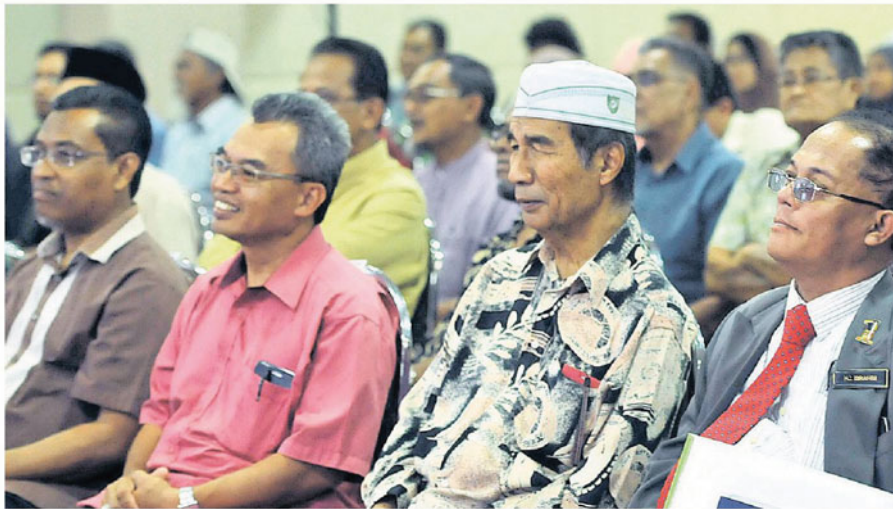
Hadirin yang hadir ke wacana Sinar Harian di Dewan Karangkrak, semalam.